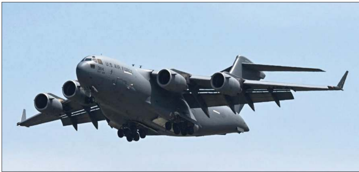
طائرة نقل عسكرية أميركية من طراز «بوينغ سي-17» إيه غلوب ماستر 3، تستعد للهبوط بقاعدة نور خان العسكرية في رواليندي بباكستان

وقال ترامب على منصفته تروث سوشال ان «سفينة شحن ترفع العلم الإيراني تدعى توسكا يبلغ طولها 900 قدم حاولت اختراق حصارنا البحري غير أن إيراني».