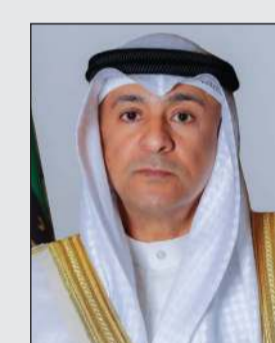
أمين عام مجلس التعاون الخليجي جاسم البديوي

خلال الساعات الماضية بهدف استئناف المحادثات اليوم كما هو مخطط لها، بحث وزير الداخلية الباكستاني محسن نقفي مع السفير الإيراني لدى إسلام آباد أميرى الترتيبات للجولة الثانية من محادثات السلام، وناقش الجانبان سبل التوصل إلى حلول مستدامة لخفض التصعيد الإقليمي عبر القنوات الدبلوماسية.