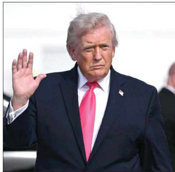
الرئيس الأميركي دونالد ترامب

عواصم - وكالات: اتمت العاصمة الباكستانية إسلام آباد استعداداتها لاستضافة الجولة الثانية والحاسمة من المحادثات بين الولايات المتحدة وإيران التي يترقب العالم عقدها اليوم، قبل يوم واحد من انتهاء مهلة الأسبوعين التي أعلنتها الرئيس دونالد ترامب لوقف النار، حيث أجرى الوسطاء الباكستانيون اتصالات مكثفة مع مسؤولي البلدين لتقريب وجهات النظر واستئناف المحادثات. وتقلت صحيفة «نيويورك بوست» عن الرئيس الأميركي تأكيداً أنه «مستعد لمقابلة كبار القادة الإيرانيين في حال تحقيق انفراجة».