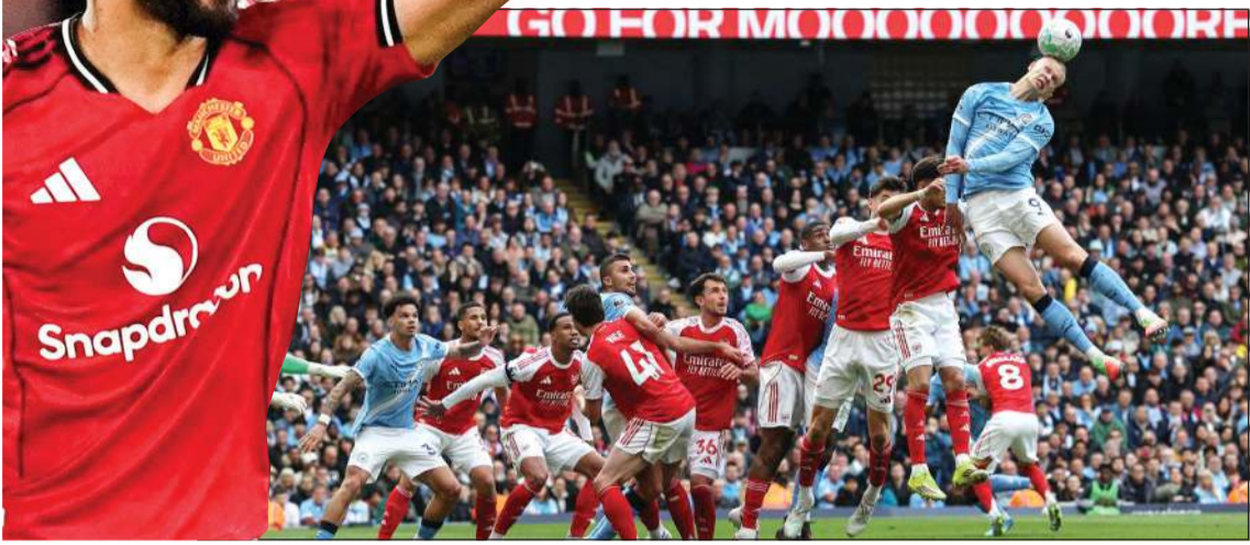
مهاجم مان سيتي إيرلينغ هالاند يحاول التسجيل في مرمى أرسنال

الأول، بعد تمريرة حاسمة من البرتغالي برونو فرنانديز، وهي التمريرة الحاسمة الـ 18 له في الدوري هذا الموسم. من جانبه، أكد مايكل كاريك مدرب مان يونايتد أن فريقه استحق الفوز على تشلسي، وقال: «نستحق الفوز، الطريقة التي لعبنا بها كانت مميزة، وذلك رغم الصعوبات في الدفاع، لكن كان الأداء الدفاعي رائعاً، مضيفاً: «كنا خطيرين في الهجمات المرتدة، والاضطراب كان مفتاح الفوز»، وفشل توتنهام في إحراز فوزه الأول له في ثاني مبارياته مع مدربه الجديد الإيطالي روبرتو دي تزيبي، مكثفاً بنقطة يتيمة رفعت رصيده إلى 31 نقطة في المركز الثامن عشر وآخر الهابطين هام السابع عشر الذي يحل ضيفاً على كريستال بالاس اليوم في ختام المرحلة.