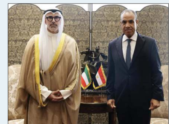
وزير الخارجية الشيخ جراح الجابر خلال اللقاء مع وزير الخارجية والتعاون الدولي والمصريين بالخارج في مصر دبير عبدالعاطي

جراح الجابر: نثمن المواقف التاريخية لمصر في دعم أمن وسيادة واستقرار الكويت ووقوفها الدائم إلى جانب أمن دول الخليج نتطلع إلى تكثيف التشاور والتنسيق مع مصر بما يساهم في الحفاظ على السلم والاستقرار الإقليميين وصون أمن الدول العربية