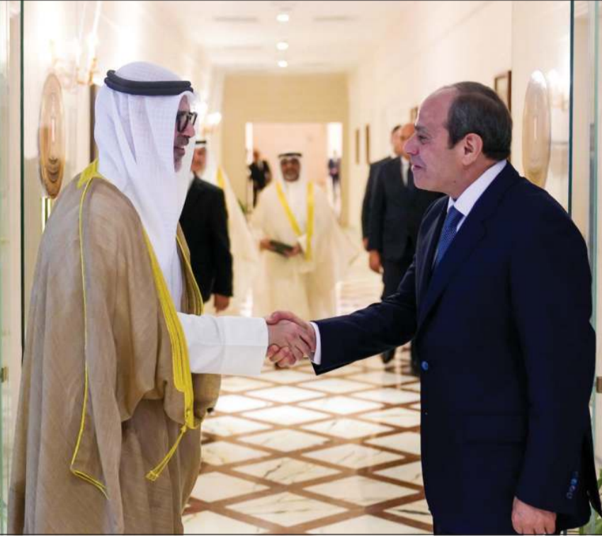
الرئيس المصري عبدالفتاح السيسي مستقبلاً وزير الخارجية الشيخ جراح الجابر

دعم مصري كامل لأمن واستقرار الكويت وتأييد كل إجراءاتها لحماية مقدرات شعبها ودعم أمن واستقرار الدول العربية بحث تعزيز العلاقات الثنائية بين البلدين بما يحقق المصالح المشتركة للشعبين