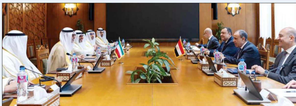
وزير الخارجية الشيخ جراح الجابر خلال المباحثات مع وزير الخارجية والتعاون الدولي والمصريين بالخارج في مصر دبير عبدالعاطي

بما يساهم في تعزيز آفاق التعاون بالقطاعات المختلفة وتحقيق تطورات الشقين نحو التنمية والازدهار