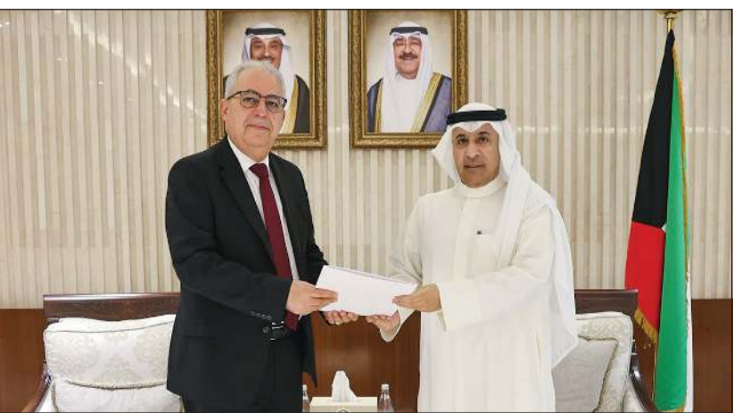
نائب وزير الخارجية بالوكالة السفير عزيز الديحاني يتسلم الرسالة من سفير المغرب علي ابن عيسى

بالإضافة إلى أبرز المستجدات على الساحتين الإقليمية والدولية. وذكرت «الخارجية» في بيان أن نائب وزير الخارجية بالوكالة السفير عزيز الديحاني تسلم الرسالة أمس خلال استقباله سفير المملكة المغربية لدى الكويت علي ابن عيسى.