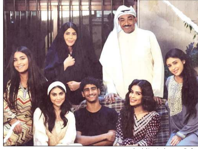
من كواليس مسلسل «غلط بنات»