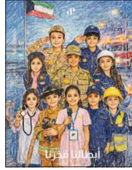
بوستر «أبطالنا فخرنا»

أطلقت شركة «أبيز برودكشنز» للإنتاج الفني والمسرحي، بقيادة الشبيخة أبرار خالد الجابر الصباح، حملة سينمائية وطنية تهدف إلى رص الصفوف وتعزيز الجبهة الداخلية عبر تكريم أبطال الصفوف الأمامية في الكويت. وفي تظاهرة فنية رائدة، نجحت الشركة في حشد نخبة من كبار نجوم ومشاهير الكويت، موحدة طاقاتهم الإبداعية لدعم الروح الوطنية عبر عملين منفصلين هما: «الوطن باقي» و«أبطالنا فخرنا».