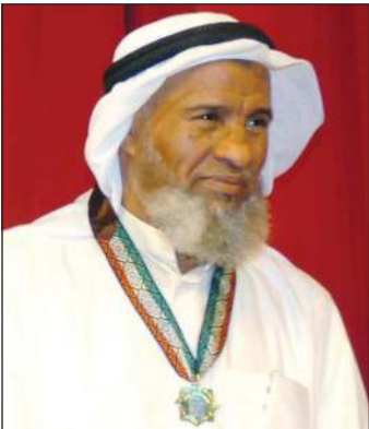
الراحل صالح موسى مكرماً في مهرجان الكويت المسرحي بدورة العاشرة عام 2008

الراحل صالح موسى الذي لم يكن يكبه لجمهور نخوي، بل لجمهور عادي حتى تصل رسالة ما يكتبه بكل سهولة.