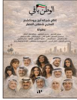
بوستر «الوطن باقي»