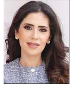
الشيخة أبرار خالد الجابر الصباح

من غزو 1990 إلى تحديات الحاضر.. «الوطن باقي» وأبطالنا فخرنا يوثقان إرادة الكويت التي لا تنكسر