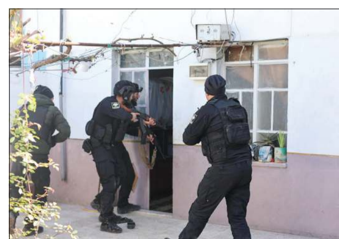
قوات الأمن تنفذ عملية مدامة

أعقبت الحادثة، أسفرت عن رصد تحركات الخلية وتحديد مواقع انتشار أفرادها، ليتم تنفيذ مدامة نوعية انتهت بالقبض على عناصر الخلية وعددهم اثنا عشر. وأوضحت أن التحقيقات الأولية أظهرت تورط أفراد الخلية في تنفيذ سلسلة من الهجمات السابقة، شملت عمليات اغتيال واستهداف لعناصر أمنية وعسكرية، إضافة إلى جرائم قتل طالت مدنيين، مشيرة إلى ضبط كميات من الأسلحة والذخائر والتجهيزات القتالية التي كانت تستخدم في تنفيذ تلك الخططات، ومصادرتها أصولاً وفق الإجراءات القانونية.