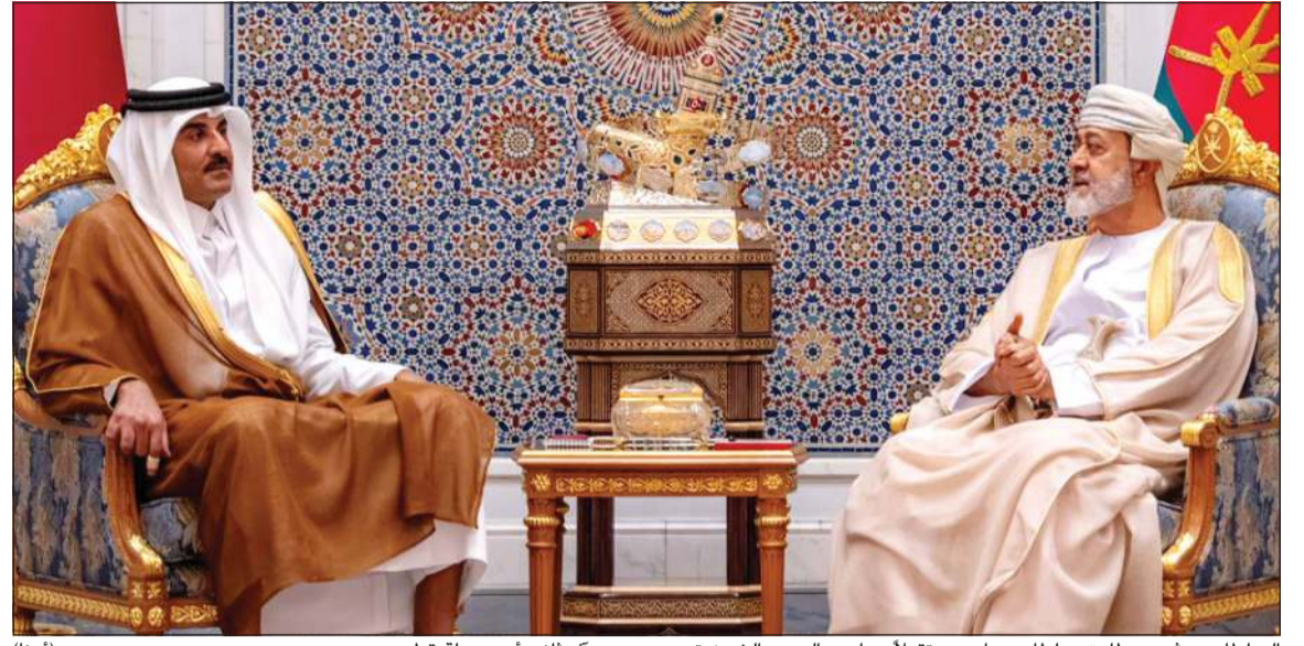
السلطان هيثم بن طارق سلطان عمان مستقبلاً صاحب السمو الشيخ تميم بن حمد آل ثاني أمير دولة قطر

مختلف المجالات. وقد أشاد سمو ولي العهد بالجهود التي يبذلها رئيس وزراء باكستان لتعزيز أوجه الشراكة الإستراتيجية بين البلدين.