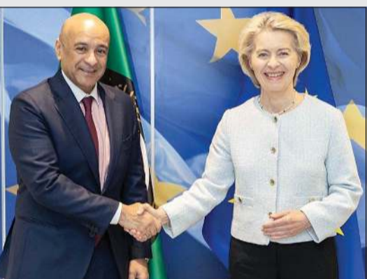
صورة نشرتها رئيسة المفوضية الأوروبية أورسولا فون دير لاين لقيتها بالأمين العام لدول مجلس التعاون الخليجي جاسم البديوي في مقر المفوضية ببروكسل

مع دول مجلس التعاون في مواجهة التحديات الأمنية.