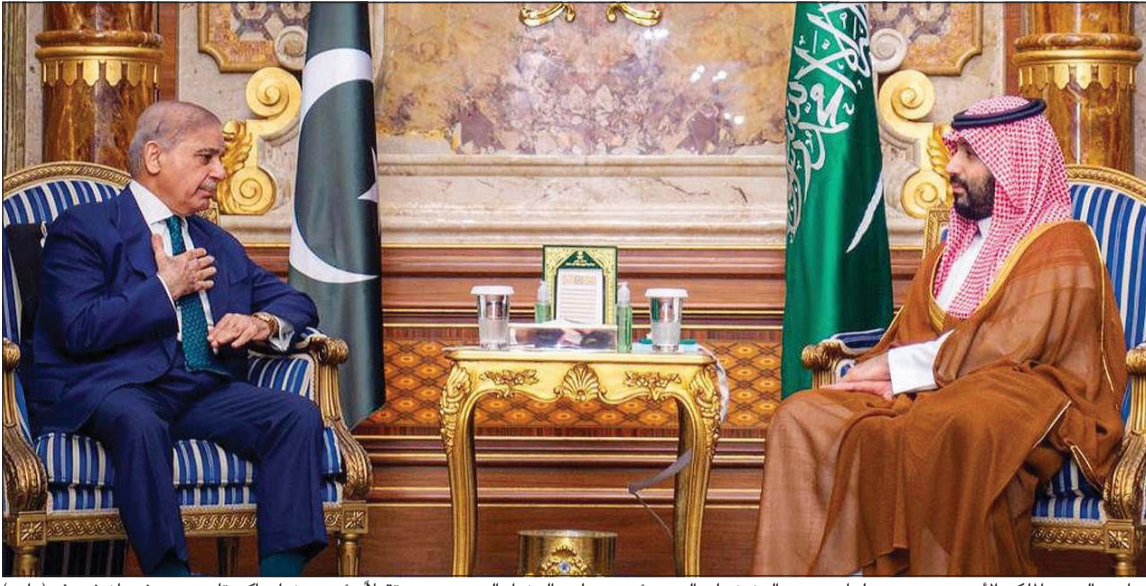
صاحب السمو الملكي الأمير محمد بن سلمان بن عبدالعزيز ولي العهد رئيس مجلس الوزراء السعودي مستقبلاً رئيس وزراء باكستان محمد شهباز شريف (واس)