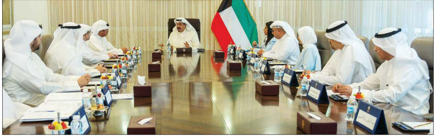
سمو الشيخ أحمد العبدالله رئيس مجلس الوزراء مترأساً اجتماع اللجنة الوزارية الـ 48 بحضور وزير الدفاع الشيخ عبدالله العلي ووزيرة الأشغال العامة د. نورة المشعان ووزير الدولة لشؤون البلدية ووزير الدولة لشؤون الإسكان عبداللطيف المشاري ووزير الكهرباء والماء والطاقة المتجددة د. صبيح المخيزيم ووزيرة الدولة لشؤون التنمية والاستدامة د. ريم الفليح ووزير الدولة للاقتصاد والاستثمار عبدالعزيز المرزوق ووزير المالية د. يعقوب الرفاعي والمستشار ديوان رئيس مجلس الوزراء د. خالد الفاضل ومدير عام هيئة تشجيع الاستثمار المباشر الشيخ د. مشعل الجابر ورئيس ديوان رئيس مجلس الوزراء بالإنيابة الشيخ خالد محمد الخالد ورئيس إدارة الفتوى والتشريع المستشار صلاح الماجد

التي تسبل تعزيزها بما يحقق المصالح المشتركة، إضافة إلى تبادل وجهات النظر حول آخر مستجدات القضايا على الساحتين الإقليمية والدولية. حضر المقابلة وزير الدفاع الشيخ عبدالله العلي ووزير الخارجية الشيخ جراح الجابر ومدير عام هيئة تشجيع الاستثمار المباشر الشيخ د. مشعل الجابر ورئيس ديوان رئيس مجلس الوزراء بالإنيابة الشيخ خالد محمد الخالد ومساعد وزير الخارجية لشؤون أوروبا السفير صادق معرفي وسفير المملكة المتحدة لبريطانيا العظمى وأيرلندا الشمالية لدى الكويت قدسي رشيد.