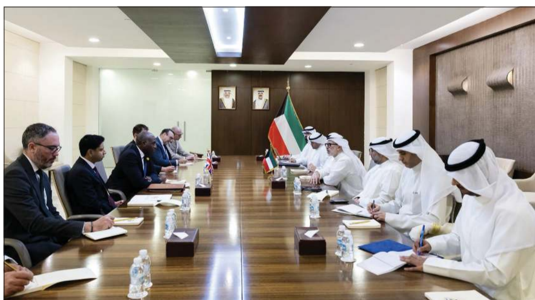
وزير الخارجية الشيخ جراح الجابر استقبله اللورد المستشار وزير العدل ونائب رئيس الوزراء في المملكة المتحدة لبريطانيا العظمى وأيرلندا الشمالية اللورد المستشار ديفيد لامي

دعم كل المساعي الرامية إلى ترسيخ دعائم الأمن والاستقرار على المستويين الإقليمي والدولي