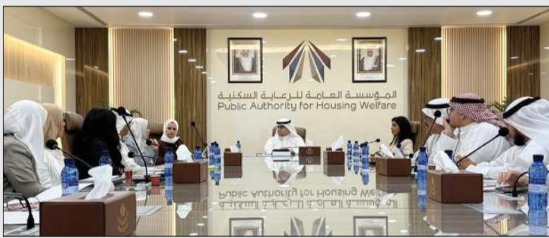
وزير الدولة لشؤون البلدية ووزير الدولة لشؤون الإسكان م. عبداللطيف المشاري ووزيرة الأشغال العامة د. نورة المشعان ووزير التجارة والصناعة أسامة بودي ووزيرة الدولة لشؤون التنمية والاستدامة د. ريم الفليح

ترأس وزير الدولة لشؤون البلدية ووزير الدولة لشؤون الإسكان م. عبداللطيف المشاري اجتماعاً وزارياً، بحضور وزيرة الأشغال العامة د. نورة المشعان، ووزير التجارة والصناعة أسامة بودي، ووزيرة الدولة لشؤون التنمية والاستدامة د. ريم الفليح، وذلك لمناقشة المشاريع التنموية في الدولة، والعمل على تسريع وتيرة الأعمال وتذليل أي معوقات على مستجدات التنفيذ.