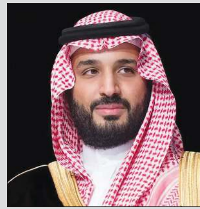
صاحب السمو الملكي الأمير محمد بن سلمان ولي العهد رئيس مجلس الوزراء رئيس مجلس إدارة صندوق الاستثمارات العامة السعودي

برئاسة ولي العهد السعودي.. «صندوق الاستثمارات» يقرّ إستراتيجيته 2026-2030 تحقيق ارتفاع بالأصول المدارة من 500 مليار ريال في 2015 لتتجاوز 3.4 تريليونات ريال في 2025