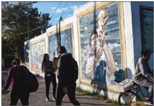
جداريات تمثل نجم كرة القدم الراحل دييغو مارادونا في مسقط رأسه

بوينس آيرس - أ.ف.ب: تحول المنزل الذي ولد فيه أسطورة كرة القدم الراحل دييغو مارادونا، في حي محروم من الضاحية الكبرى لبوينس آيرس، في الأسابيع الأخيرة إلى مكان لتقديم وجبات مجانية. وتبدو قبلاً فيورنتو، الواقعة على بعد نحو ساعة من وسط العاصمة، وهي ضاحية كغيرها من الضواحي المحيطة بها مكونة من مساكن اسمنتية، كأنها في ورشة بناء دائمة ومعظم الشوارع ترابية. وكان مارادونا يرد عن مكان طفولته «نشأت في حي (خاص).. محروم من المياه، محروم من الأسفلت، محروم من كل شيء»، في إشارة ساخرة إلى ما يعرف بـ«كاونترى»، وهي المجمعات السكنية الخاصة الفاخرة. لا يزال بطل موندريال 1986 حاضراً في القلوب. ويقول برس دييغو غافيلان الذي جاء ليحصل على وجبة أمام منزل مارادونا لفرانس برس: «لو كان على قيد الحياة لقال دييغو إن هناك الكثير من الجوع، وإنه يجب المساعدة. هناك الكثير من الاحتياجات، الكثير جداً من الاحتياجات».