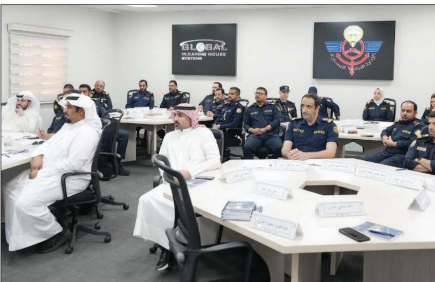
مشاركة واسعة في الورشة

نظمت الإدارة العامة للجمارك ورشة عمل متخصصة بعنوان «مكافحة جرائم غسل الأموال وتمويل الإرهاب وإجراءات مكافحة تهريب العملات عبر الحدود»، وذلك في مركز التدريب بمنطقة (3) - الشويخ.