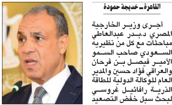
وزير الخارجية المصري د.جديعة حمودة

الفترة المقبلة في إطار دعم الجهود المشتركة لتحقيق التهدئة وتعزيز الاستقرار في المنطقة. من جهة أخرى، التقى وزير الخارجية المصري، بحضور م.خالد هاشم وزير الصناعة، رئيس جمهورية تارستان في روسيا الاتحادية رستم مينبخانوف، وذلك في إطار الزيارة الرسمية التي يجريها إلى مصر. وأشاد عبد العاطي بالرخم الذي تشهده العلاقات الاستراتيجية بين مصر وروسيا الاتحادية في جميع المجالات، بما في ذلك السياسية والدبلوماسية مشيداً بالطفرة التنموية التي تشهدها تارستان لاسيما في المجالات الصناعية والتكنولوجية والزراعية، مؤكداً الحرص على تعزيز العلاقات الاقتصادية مع