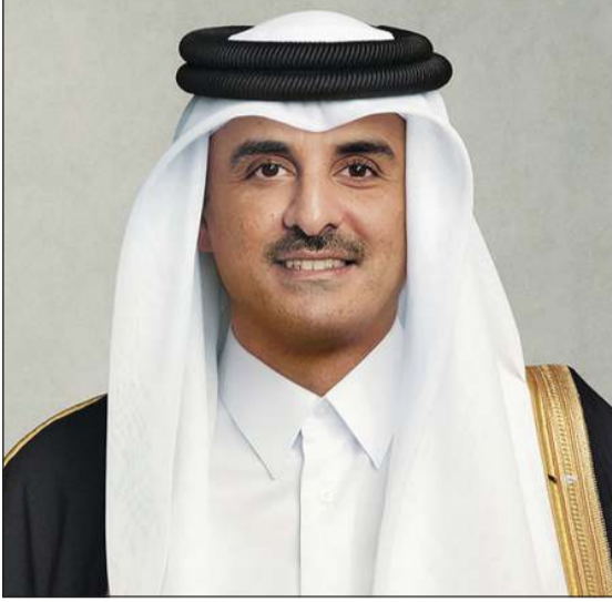
صاحب السمو الشيخ تميم بن حمد آل ثاني أمير دولة قطر