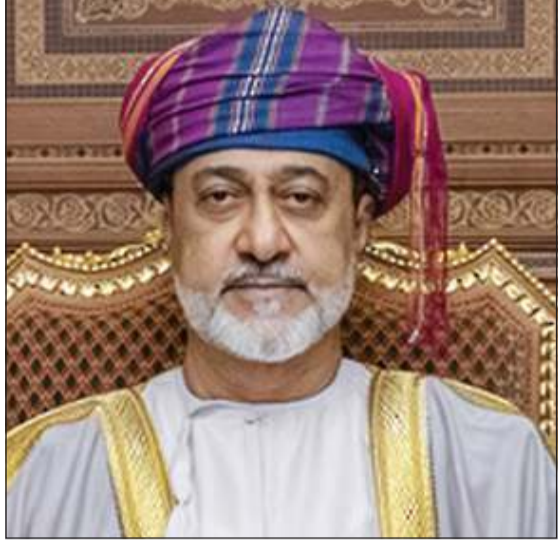
جلالة السلطان هيثم بن طارق سلطان عمان

إلى أن قطر «تشدد منذ البداية على ضرورة وجود حل دائم لتثبيت وقف إطلاق النار»، معتبراً أن «وقف إطلاق النار لا يعني وقف الحرب ولا حاجة لوساطة جدد ودعم وساطة باكستان». وقال: «يجب استمرار وقف إطلاق النار بين إيران وأميركا والتركيز ينصب الآن على تثبيت ذلك»، على أن «وقف إطلاق النار لا يعني وقف الحرب ولا حاجة إلى وساطة جدد ودعم وساطة باكستان». وسيدهد دوراً إقليمياً. وأضاف: لا تقوم بدور وساطة لكن هناك تنسيقاً عالمياً مع باكستان والولايات المتحدة والأشقاء». واعتبر «حل أزمة مضيق هرمز يجب أن يكون إقليمياً بمشاركة الدول المتشاطئة والتي تعتمد عليه»، مشيراً إلى أن «الوضع في مضيق هرمز طارئ ويجب على الجميع العمل للوصول إلى حل مستدام، ولم تكن هناك أي مشكلة في إدارة مضيق هرمز وتداعيات إغلاقه تتجاوز أسواق الطاقة».