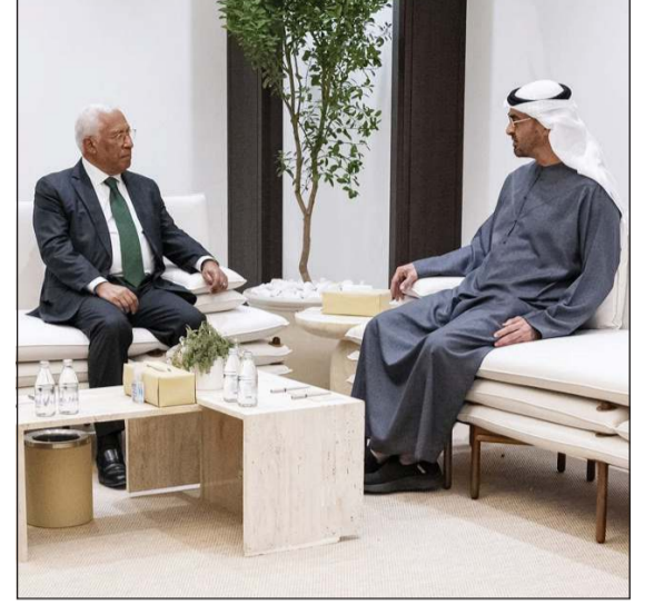
صاحب السمو الشيخ محمد بن زايد آل نهيان رئيس دولة الإمارات مستقبلاً رئيس المجلس الأوروبي أنطونيو كوستا