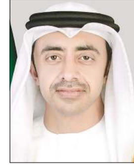
نائب رئيس مجلس الوزراء وزير خارجية الإمارات سمو الشيخ عبدالله بن زايد