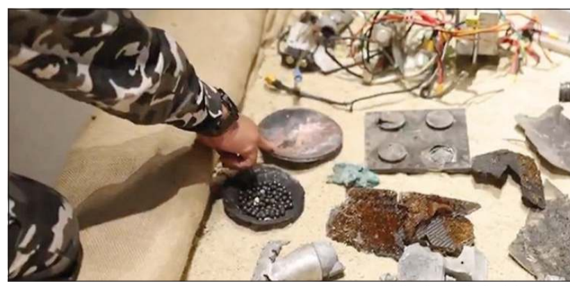
جانب من مخلفات التعامل مع الشظايا

وأضاف وكيل الوزارة وفق البيان «أن ما يشهده العمل الميداني حالياً من تنسيق واتساجم بين الجيش الكويتي ووزارة الداخلية والحرس الوطني» يعكس مستوى متقدماً من الكفاءة والجاهزية ويجسد تكاملاً فعالاً في الأداء وتوحيداً للجهود في مواجهة التحديات. وأعرب عن شكره وتقديره لكافة منتسبي الجهات العسكرية والأمنية على ما يبذلونه من جهود مخلصة وعطاء مستمر في خدمة الوطن.