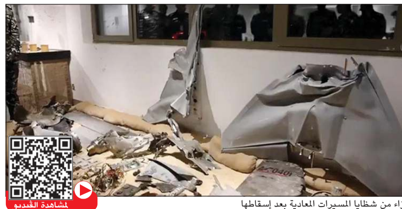
أجزاء من شظايا المسميرات المعادية بعد إسقاطها

وكونا: أكد وكيل وزارة الداخلية اللواء عبدالوهاب الوهيب أن التواصل المباشر والتكامل بين مختلف الجهات يعد ركيزة أساسية لتعزيز الجاهزية وتحقيق الاستجابة الفاعلة لمتطلبات المرحلة.