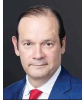
وزير خارجية بنما خافيير فاسكينز