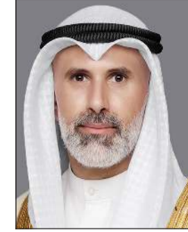
وزير الخارجية الشيخ جراح الجابر

كونا: أجرى وزير الخارجية الشيخ جراح الجابر اتصالا هاتفيا مع وزير خارجية المملكة العربية السعودية الشقيقة صاحب السمو الأمير فيصل بن فرحان.