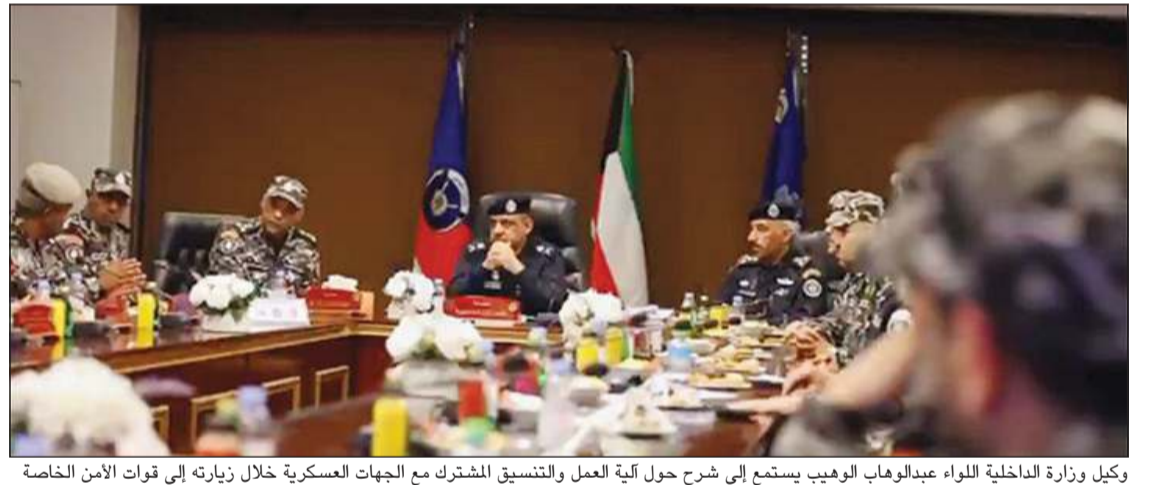
وكيل وزارة الداخلية اللواء عبدالوهاب الوهيب يستمع إلى شرح حول آلية العمل والتنسيق المشترك مع الجهات العسكرية خلال زيارته إلى قوات الأمن الخاصة

قوات الأمن الخاصة تعكس صورة الكويت ومؤسساتها في أداء واجبها الوطني