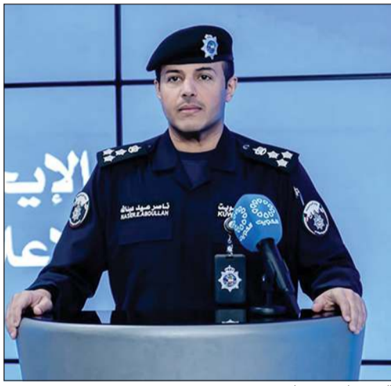
العميد ناصر بوضليب

العميد ناصر بوضليب: نهيب بالمواطنين تأجيل أنشطة الصيد في المناطق البرية كإجراء احترازي يعكس الوعي والمسؤولية