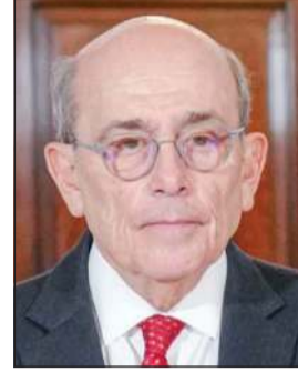
وزير خارجية بيرو هوغو مارتينز