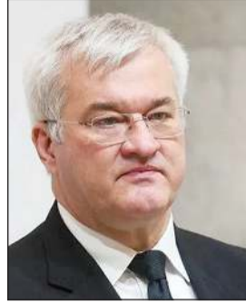
وزير خارجية أوكرانيا اندرية سيبيها