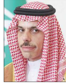
وزير الخارجية السعودي صاحب السمو الأمير فيصل بن فرحان