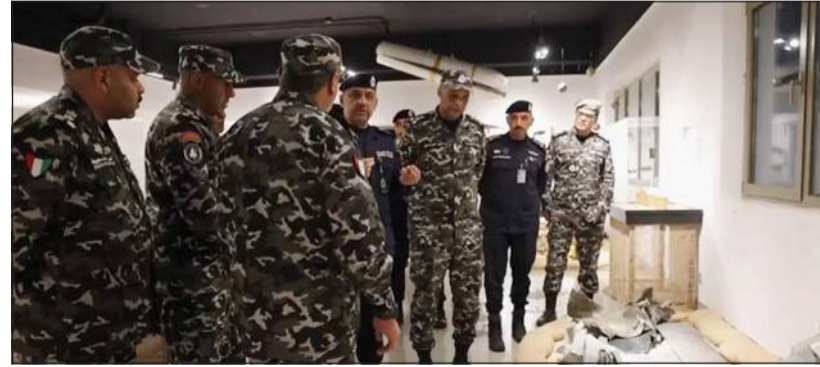
وكيل وزارة الداخلية اللواء عبدالوهاب الوهيب مستمعاً إلى شرح من رئيس قطاع الأمن الخاص للمؤسسات الإصلاحية العميد نخيل الدخيل خلال الزيارة

قوات الأمن الخاصة تعكس صورة الكويت ومؤسساتها في أداء واجبها الوطني