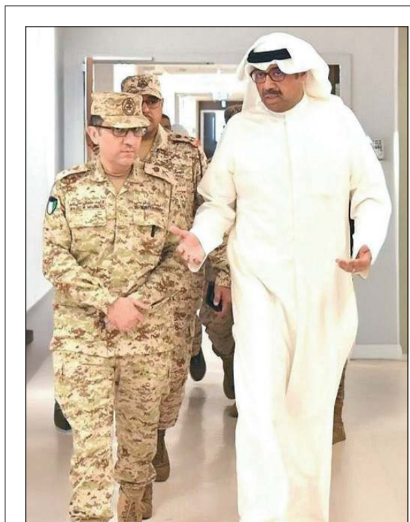
وزير الدفاع الشيخ عبدالله العلي في مستشفى الجوهراء للأطمنان على الحالة الصحية لأحد المصابين من منتسبي القوات المسلحة

وتم خلال الاجتماع، استعراض الخطط والإجراءات اللازمة لإعداد الملفات الفنية والتوثيقية، إلى جانب بحث آليات التعاون