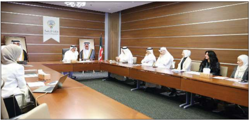
وزير التربية م. سعيد جلال الطبطبائي خلال الاجتماع مع المندوب الدائم للكويت لدى اليونسكو - باريس د. علي المصنف وعدد من المسؤولين المعنيين بالملف الثقافي

المؤسسي بما يضمن تكامل الأدوار وتسريع وتيرة العمل. وأسفر الاجتماع عن توجيه الوزير الطبطبائي بتشكيل قرار لجنة مشتركة تضم الجهات المعنية، تتولى العمل على تذليل التحديات واستكمال متطلبات إدراج الملفات، بما يعزز فرص تسجيلها ضمن قائمة التراث العالمي.