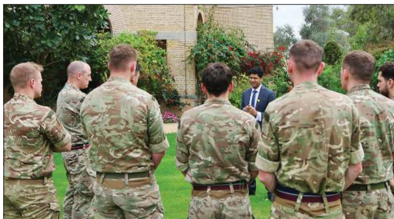
السفير البريطاني لدى الكويت قديسي رشيد خلال لقائه أفراداً من فوج سلاح الجو الملكي البريطاني