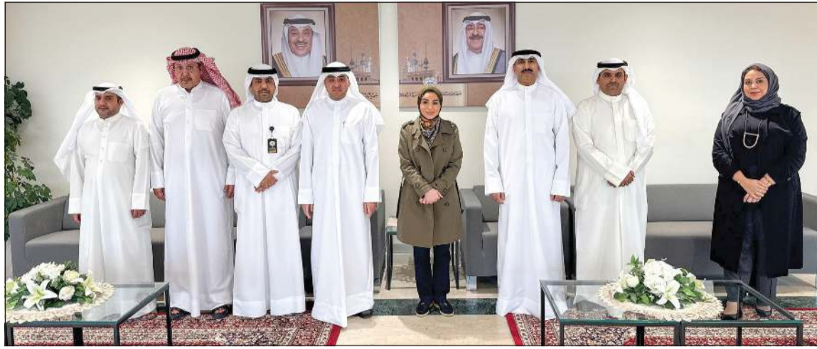
وزيرة الشؤون الاجتماعية وشؤون الأسرة الطفولة دامثال الحويلة خلال اجتماع مع مسؤولي إدارة رعاية الأحداث لمتابعة سير العمل

بيئة الإيواء وآلية العمل داخل الإدارة واستمعت إلى شرح مفصل من المسؤولين حول الخطط المعتمدة لإعادة تأهيل الأحداث ودمجهم في المجتمع.