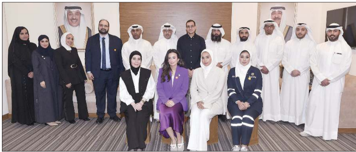
خلال أعمال التدريب في دورة نظم المعلومات الجغرافية «GIS»

المخاطر والاستجابة لها. وباتى هذا التعاون تايكيدا وتنفيذاً لقرار مجلس الوزراء رقم 1511 لسنة 2024 بتكليف الهيئة بأن تكون إدارة الطوارئ لنظم المعلومات الجغرافية في الكويت للاستفادة من الخبرات الفنية والتقنية والاستشارية التي تقدمها الهيئة لمختلف جهات الدولة.