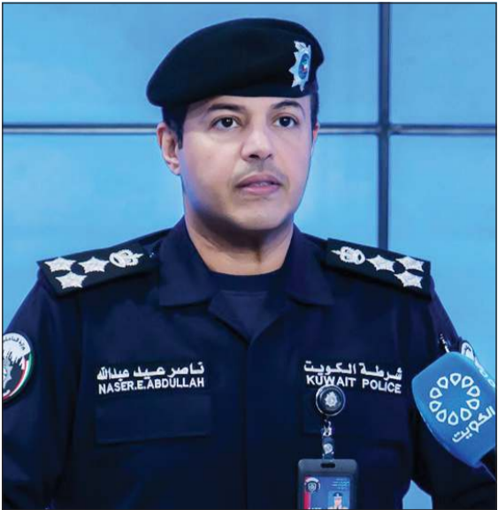
العميد ناصر بوضيليق

«الداخلية»: الأوضاع في البلاد مستقرة وأمنة وتحت السيطرة الكاملة.. وفرق التخلص من المتفجرات تعاملت مع 17 بلاغاً بسقوط شظايا من أحداث الأيام الماضية