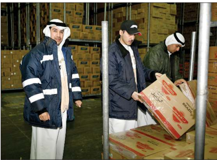
فحص المجدات داخل ثلاجات الحفظ