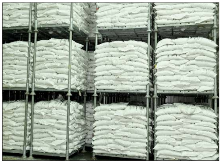
جانب من المواد الغذائية