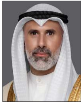
وزير الخارجية الشيخ جراح الجابر

أشاد خلال الاتصال بالجهود الدبلوماسية التي اضطلعت بها جمهورية باكستان الإسلامية والتي أسهمت في التوصل إلى إعلان وقف إطلاق النار بين الولايات المتحدة الأمريكية والجمهورية الإسلامية الإيرانية. وتلقى الشيخ جراح الجابر اتصالاً هاتفياً من نائب رئيس الوزراء وزير الخارجية والتعاون الدولي بالجمهورية الإيطالية الصديقة محمد إسحاق دار عن وزارة الخارجية فقد تم خلال الاتصال مناقشة تطورات الأحداث الراهنه في المنطقة والجهود المبذولة بشأنها. في بيان أن الشيخ جراح