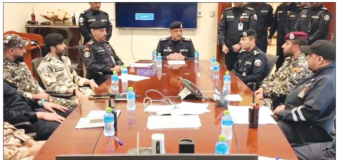
وكيل وزارة الداخلية اللواء عبدالوهاب الوهيب مع القيادات والضباط خلال جولته في الإدارة العامة لأمن المنشآت

العمل بروح الفريق الواحد لرفع كفاءة المنظومة الأمنية وتعزيز التنسيق والتكامل بين مختلف القطاعات