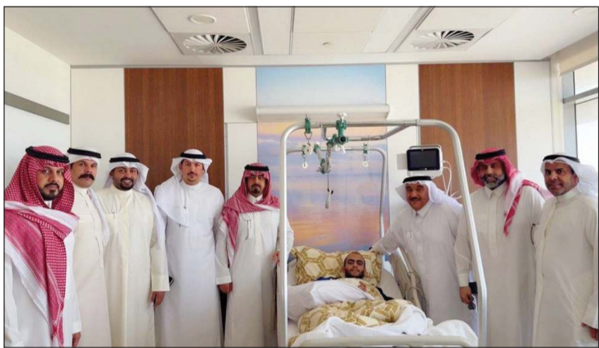
منتسبو السفارة السعودية خلال زيارة أحد المصابين