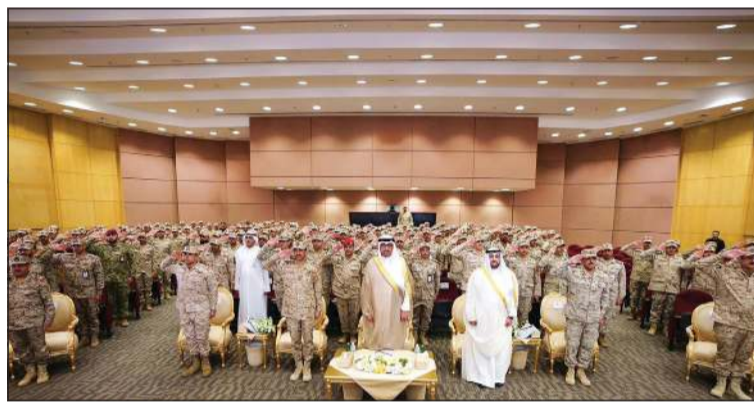
وزير الدفاع الشيخ عبدالله العلي ورئيس الأركان العامة للجيش الفريق الركن خالد الشريهان ووكيل وزارة الدفاع الشيخ د.عبدالله المشعل ونائب رئيس الأركان العامة للجيش اللواء الركن طيار الشيخ صباح جابر الأحمد وأمر كلية علي الصباح العسكرية العميد الركن عبدالله التركيت وعدد من كبار الضباط القادة بالجيش خلال مراسم تخريج الدفعة (24)