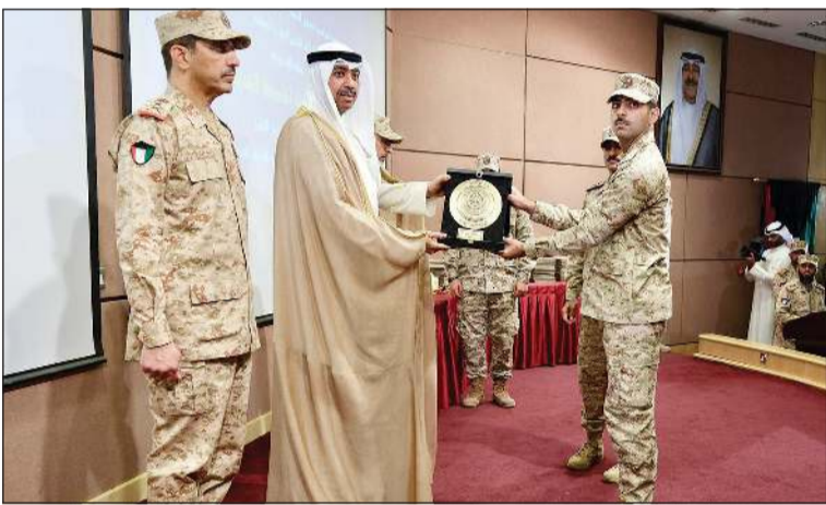
وزير الدفاع الشيخ عبدالله العلي خلال تكريم أحد الخريجين بحضور رئيس الأركان العامة للجيش الفريق الركن خالد الشريهان