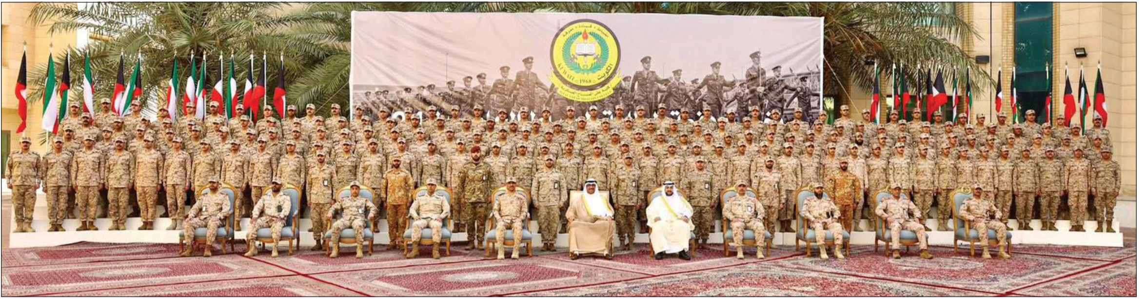
وزير الدفاع الشيخ عبدالله العلي ورئيس الأركان العامة للجيش الفريق الركن خالد الشريهان ووكيل وزارة الدفاع الشيخ د.عبدالله المشعل ونائب رئيس الأركان العامة للجيش اللواء الركن طيار الشيخ صباح جابر الأحمد وأمر كلية علي الصباح العسكرية العميد الركن عبدالله التركيت وعدد من كبار الضباط القادة بالجيش مع الدفعة الـ 24 للطلبة الخريجين

أعرب خلال حضوره مراسم تخريج الكلية علي الصباح العسكرية عن اعترازه بالرعاية الأميرية السامية للمناسبة