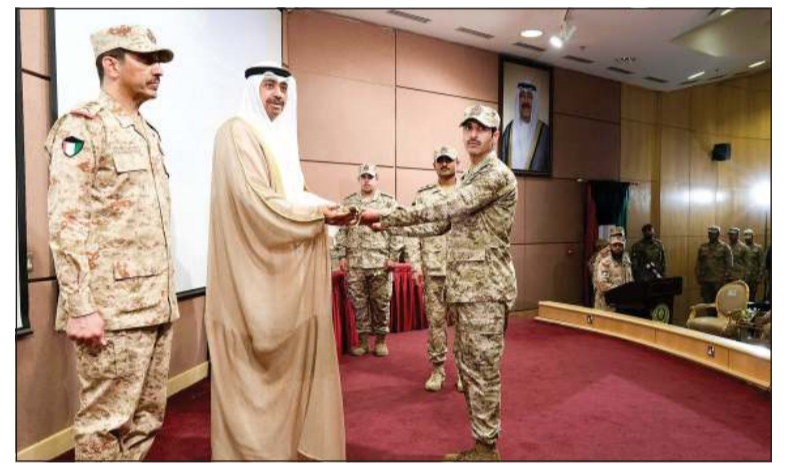
وزير الدفاع الشيخ عبدالله العلي مكرماً أحد الخريجين بحضور رئيس الأركان العامة للجيش الفريق الركن خالد الشريهان

رئيس الأركان العامة للجيش الفريق الركن خالد الشريهان، ووكيل وزارة الدفاع الشيخ د.عبدالله المشعل، ونائب رئيس الأركان العامة للجيش اللواء الركن طيار الشيخ صباح جابر الأحمد، وأمر كلية علي الصباح العسكرية العميد الركن عبدالله التركيت، وعدد من كبار الضباط القادة بالجيش.