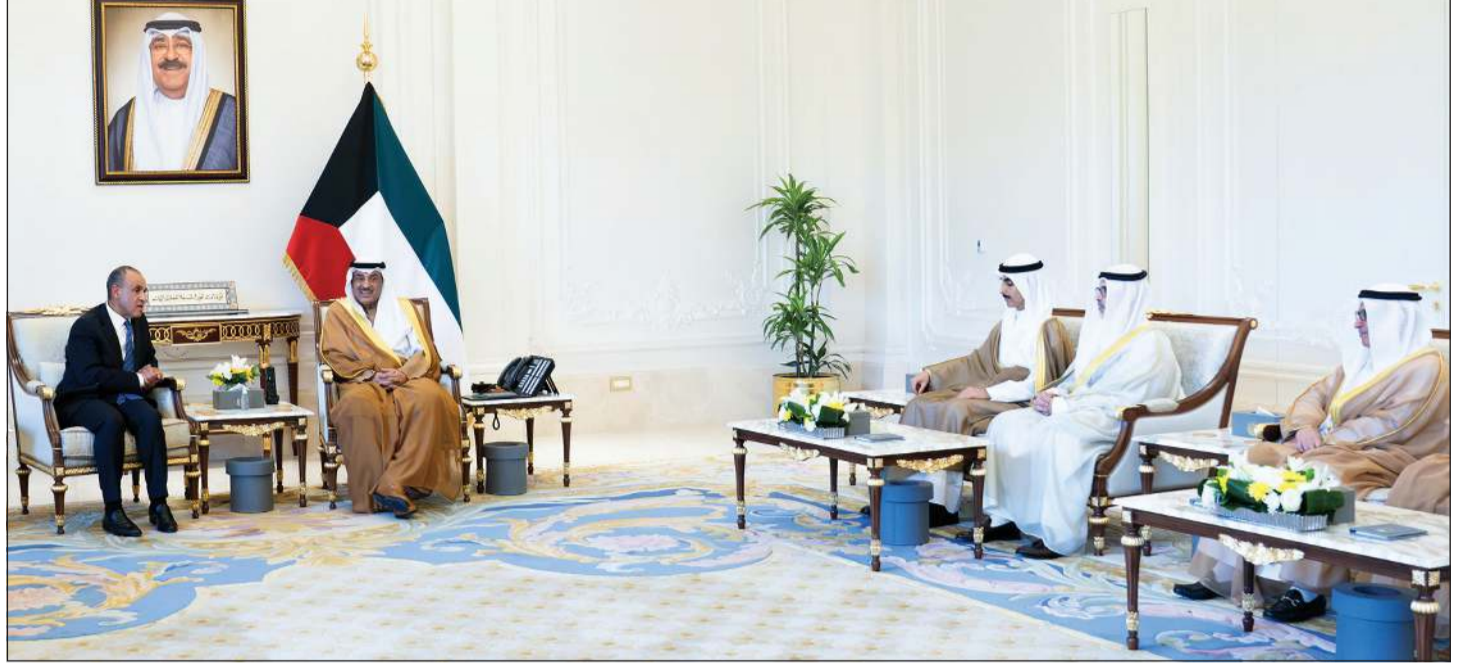
سمو ولي العهد الشيخ صباح الخالد خلال استقباله وزير الخارجية والتعاون الدولي والمصريين بالخارج د.بدر عبدالعاطي بحضور رئيس ديوان سمو ولي العهد الشيخ ثامر الجابر ووزير الخارجية الشيخ جراح الجابر والسفير منصور العتيبي

إزاء التطورات التي تشهدها المنطقة، وذكرت وزارة الخارجية المصرية في بيان أن الزيارة تأتي في إطار الموقف المصري الثابت الداعم لدولة الكويت وكل الدول الخليجية الشقيقة وتأكيد تضامن مصر الكامل مع أشقاها خلال هذه المرحلة الدقيقة.