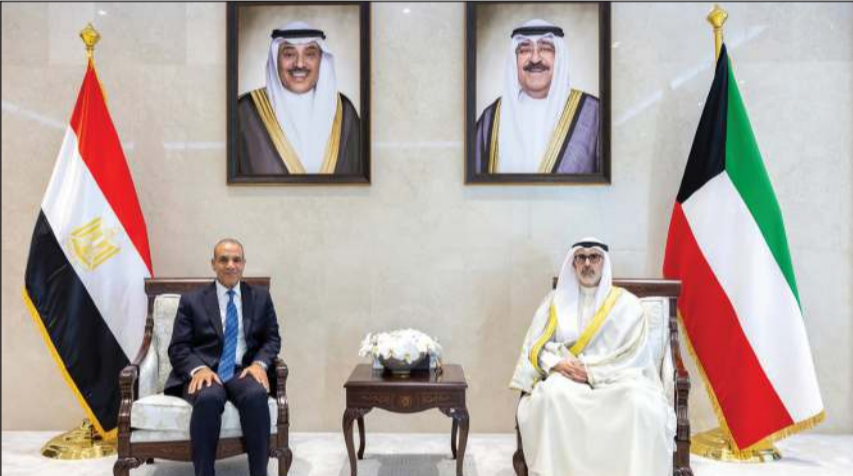
وزير الخارجية الشيخ جراح الجابر الأحمد مستقبلاً وزير الخارجية والتعاون الدولي والمصريين بالخارج د.بدر عبدالعاطي

إسبانيا الصديقة خوسيه إيبانيس، حيث تم خلال الاتصال مناقشة تطورات الأحداث الراهنة في المنطقة والجهود المبذولة بشأنها.