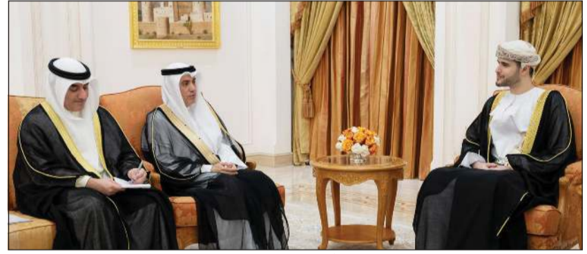
وزير الدولة ومحافظ مسقط السيد بلعرب بن هيثم آل سعيد خلال اللقاء مع سفيرنا لدى سلطنة عمان د.محمد الهاجري

تطلعات قيادتي البلدين والشعبين الشقيقين نحو مزيد من التقدم والأزدهار.