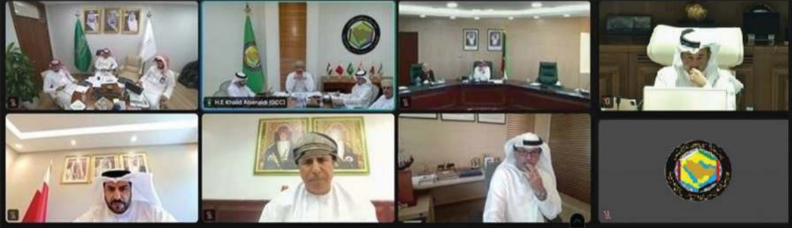
مدير عام الهيئة العامة لشؤون الزراعة والثروة السمكية سالم الحاي خلال مشاركته في اجتماع وكلاء الوزارات المعنية بالزراعة والأمن الغذائي بدول «التعاون»

بين هذه القطاعات الداعمة لمنظومة الأمن الغذائي. وشهد المجتمعون على أهمية تسهيل إجراءات العبور والتخليص الجمركي وتعزيز كفاءة النقل البري والبحري والجوي وتوفير مسارات لوجستية مرنة تضمن وصول السلع الغذائية لا سيما الأساسية وسريعة التلف في الوقت المناسب.