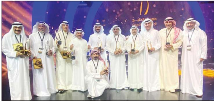
صورة جماعية للفائزين بجوائز الدورة الـ 16 للمهرجان يتوسطهم رئيس الوفد التركي المطيري