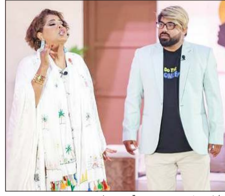
هيا في مشهد من مسرحية «ستريك»

وعن سر تواجدتها بفترة طويلة في القاهرة بعيداً عن الدراسة، أوضحت: أشعر براحة كبيرة هناك، فأنا عاشقة لمصر وأهلها وترتيبني علاقات طيبة بالكثيرين فيها. وعن تلقيها عروضاً للمشاركة في أعمال مسرحية مصرية قالت: لا، لم أتلق عروضاً، وبالرغم أنني على علاقة طيبة بالكثير من شركات الإنتاج هناك مثل السبكي وغيرها إلا أنني لست من نوعية الفنانين الذين يفرضون أنفسهم على