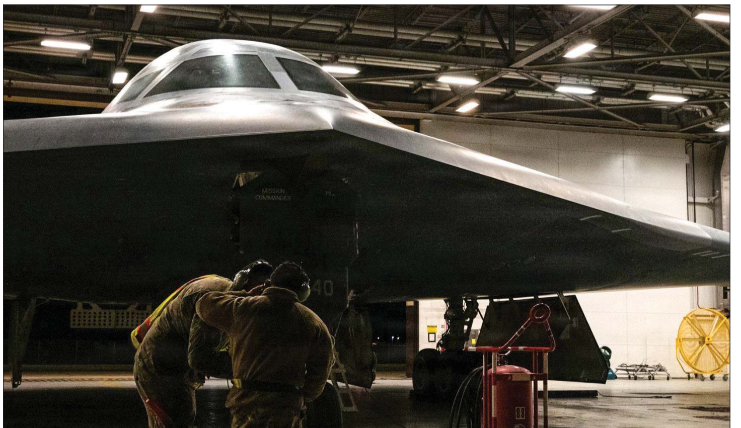
صورة نشرتها القيادة المركزية الأميركية «سنتكوم» لطاقم من القوات الجوية أثناء الفحوصات الفنية لقاذفة «بي 2 سيبريت» الشبحية قبيل تنفيذها مهمة ضمن عملية «الغضب المحمي» العسكرية

وأضاف: «بموجب الاتفاقية بدأنا نقل المنتجات التي لا يمكن نقلها عبر مضيق هرمز إلى دول الخليج وهذا الأمر سيسرع وتيرة التجارة المتبادلة بين دول المنطقة». وذكر الوزير التركي أن العالم يمر بفترة من عدم اليقين الشديد وأنهم يبذلون قصارى جهدهم لحماية المصالح