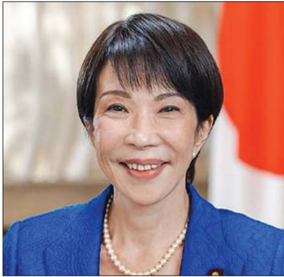
رئيسة وزراء اليابان سانا تাকাيتشي