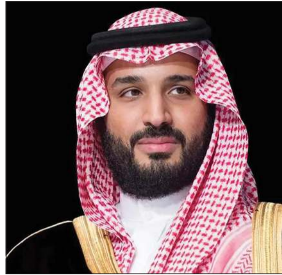
صاحب السمو الملكي الأمير محمد بن سلمان ولي العهد رئيس مجلس الوزراء السعودي