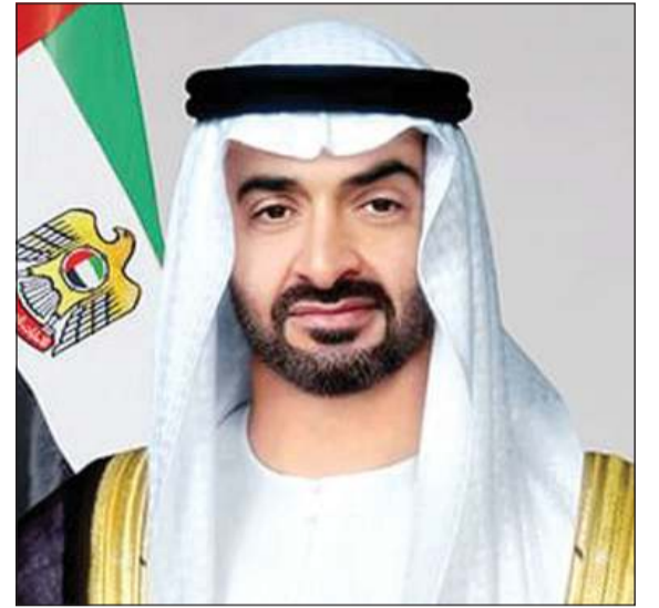
صاحب السمو الشيخ محمد بن زايد آل نهيان رئيس دولة الامارات العربية المتحدة

يقود إلى سيناريوهات كارثية لن يكون أي طرف بمنأى عن تبعاتها.