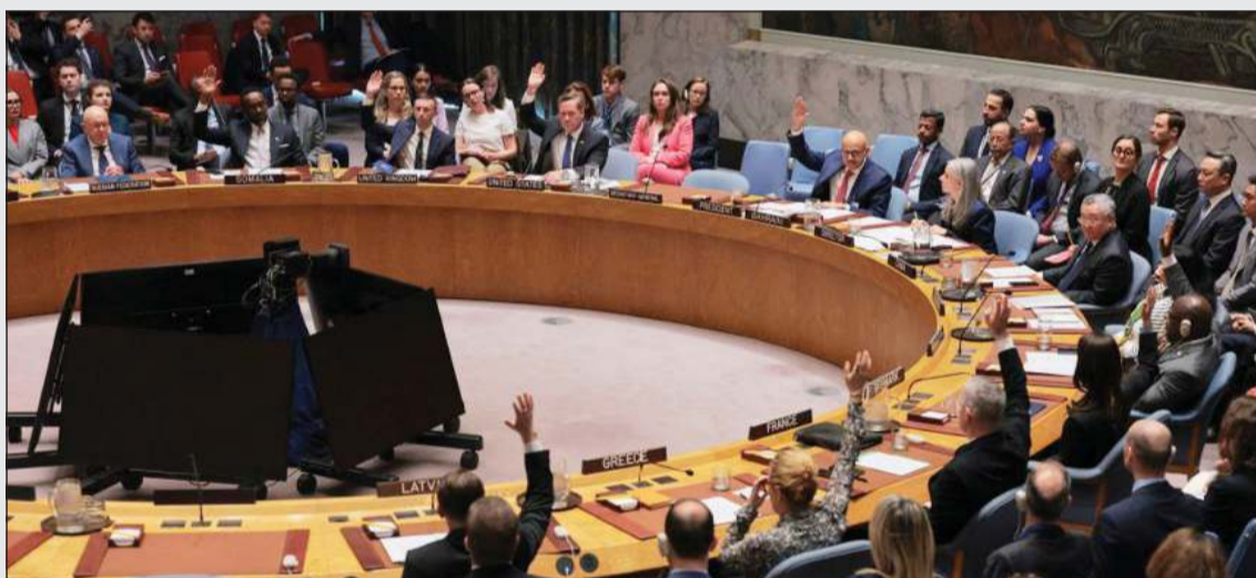
جانب من جلسة التصويت في مجلس الأمن على مشروع قرار فتح مضيق هرمز (أ.ف.ب)

في مرور البضائع بمضيق هرمز له تأثير سلبي عالمي. وأضاف: مضيق هرمز تمر عبره كميات ضخمة من النفط والغاز والأدوية والأغذية. وتابع: ليس من حق إيران إغلاق مضيق هرمز أمام الملاحة. إذا سمح مجلس الأمن بإبقاء مضيق هرمز مغلقا فسيتركز الوضع في مضائق أخرى. وأكد أن مشروع القرار المطروح لا يخلق واقعا جديدا بل يشكل معالجة جديدة لسلوك إيراني عدائي متكرر، معتبرا أن «إصرار إيران على تعطيل الملاحة الدولية ليس طارئا بل يأتي ضمن نهج سلبي موفق».