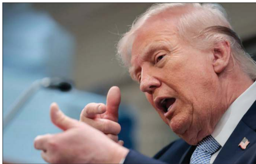
الرئيس الأميركي دونالد ترامب متحدثا عن الصراع مع إيران بمؤتمر صحافي في البيت الأبيض

وتابع: «مع ذلك، الآن وقد تحقق التغيير الجذري والشامل للنظام، حيث تسود عقول مختلفة، أكثر ذكاء، وأقل تطرفا، فربما يحدث شيء رائع ثوري.. من يدري؟». وأضاف «في واحدة من أهم اللحظات في تاريخ العالم الطويل والمعقد. 47 عاما من الابتزاز والفساد والموت ستنتهي أخيرا». من جهته، أكد نائب الرئيس الأميركي جي دي فانس أن «واشنطن حققت أهدافها العسكرية في إيران إلى حد كبير». وحذر دي فانس، في مؤتمر صحافي مع رئيس