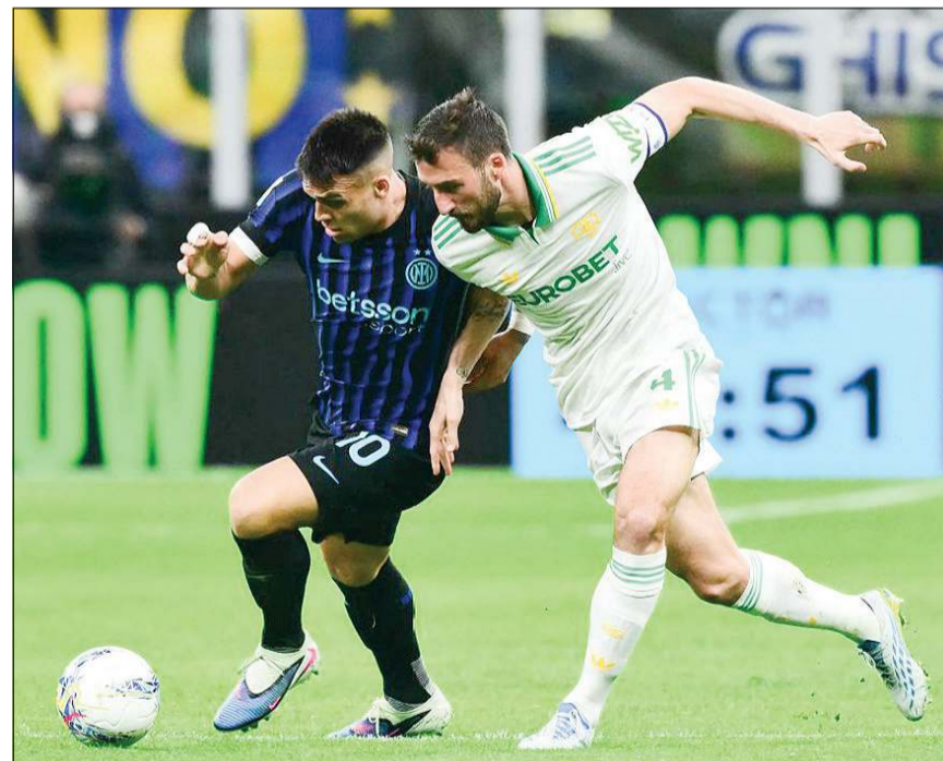
لاوتارو مارتينيز تلقى وسجل هدفين في مرمى روما

استعاد إنتر توازنه بعد ثلاث مباريات عجاظ تواليا في الدوري الإيطالي لكرة القدم، بإكرامه وفادة ضيفه روما 2-5 ضمن المرحلة الحادية والثلاثين.