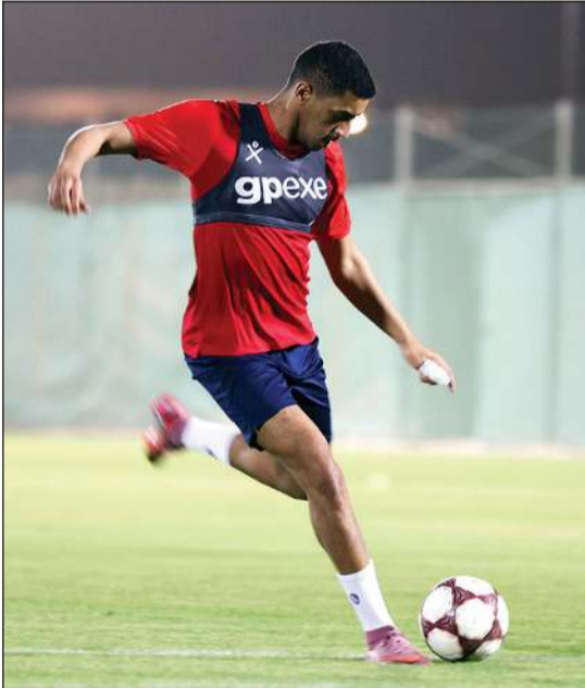
(المركز الإعلامي للكويت)