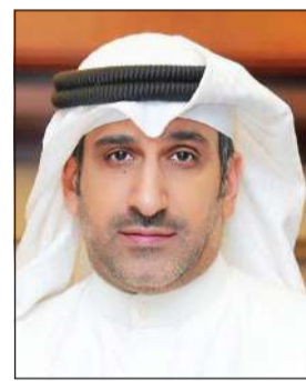
الكاتب عبد الوهاب الشطي

نظمت شركة الخطوط الجوية الكويتية ورشة عمل توعوية متخصصة لتدريب الموظفين حول إجراءات الأمن والسلامة قبل وبعد الظروف الحالية، وما استجد من تحديثات على العمليات التشغيلية، لاسيما تلك المتعلقة بسلامة الطائرات، وذلك في إطار حرصها على أمن وسلامة الركاب وموظفيها، وتعزيز جاهزيتها التشغيلية لمواجهة المتغيرات الراهنة التي تشهد المنطقة. وفي هذا الصدد، أكد الرئيس التنفيذي بالتكليف الكاتب عبد الوهاب الشطي أن الأمن والسلامة يمثلان حجر الأساس للتنميش التشغيلي واستدامة الأعمال في الخطوط الجوية الكويتية، مشيراً إلى أنها مسؤولة مشتركة يلتزم بها جميع لحماية سلامة المسافرين