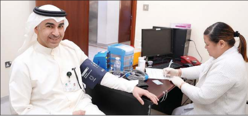
جانب من تبرع موظفي مجموعة الملا بالدم ضمن مبادراتها التطوعية

تظمت مجموعة الملا مؤخرًا مبادرة تطوعية للتبرع بالدم لجميع موظفيها بالتعاون مع بنك الدم المركزي الكويتي، وذلك تأكيداً على التزامها الراسخ بصحة المجتمع ودعمًا لجهود الرعاية الصحية الوطنية في ظل الظروف الراهنة التي تمر بها البلاد. وناتى هذه المبادرة التي أقيمت يوم الخميس 2 أبريل الجاري، في مقر بنك الدم المركزي الكويتي في منطقة الجارية لترسخ استراتيجية المجموعة في المسؤولية المجتمعية، وتعكس نهجها الثابت في مساندة جهود الحكومة الكويتية لتعزيز منظومة الرعاية الصحية، لاسيما في ظل المرحلة التي تشهدها البلاد والمنطقة.