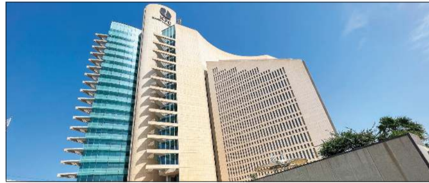
مبنى مؤسسة البترول

كونا: أعلنت مؤسسة البترول الكويتية عن تعرض عدد من المرافق التشغيلية التابعة لها في كل من شركة البترول الوطنية الكويتية وشركة صناعة الكيماويات البترولية لاستهداف واعتداء إيراني آثم بواسطة طائرات مسيرة، ما أسفر عن اندلاع حرائق في عدد من تلك المرافق وخسائر مادية جسيمة.