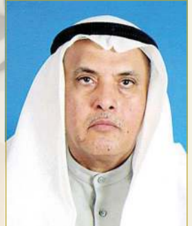
بقلم: د. يعقوب يوسف الغنيم

بلادي لك المجد التليد ولم يزل لك اليوم ما تُبدين فيه تقدماً وسوف نتالين الذي أنت أهله وسوف تزيين المعتدي متالما سهرنا لكي تبقى كما أنت حرّة وليس على الأوطان نُستكثُر الدُما دعانا إلى نصر البلاد أميرنا فلم ير منا واحداً كان أحجما فيا فارساً قاد البلاد بهمة وعزم به صوت الفخار ترمّما أدّر دفة الحرب التي أنت أهلها وبادر إليها واجعل الخصم هائما