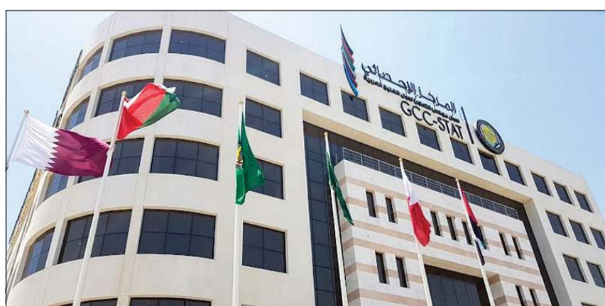
المركز الإحصائي الخليجي

في هطول الأمطار بنسبة 49,4% بدول المنطقة