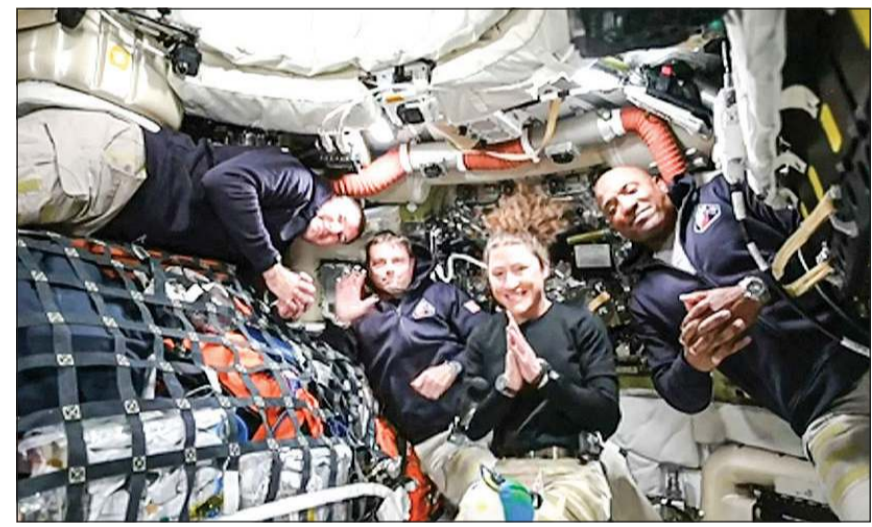
رواد الفضاء الأربعة أعضاء مهمة «أرتيميس 2» على متن المركبة أوريون في طريقهم نحو القمر

وتحمل «أوريون» في هذه الرحلة الأميركية كريستينا كوك، وفكتور غلوفر، وريد وايزمان، والكندي جيريمي هانسن. وتعود آخر رحلة مأهولة إلى مدار القمر إلى برنامج «أبولو» قبل أكثر من نصف قرن. ويوثق الرواد أوقاتهم في الفضاء بأنفسهم باستخدام هواتفهم الذكية وكاميراتهم، وتوثق وكالة ناسا مشاهد مباشرة لهم. ونشرت الوكالة الجمعة أولى الصور التي التقطها الرواد للأرض، من بينها صور لها وهي تمر أمام الشمس.