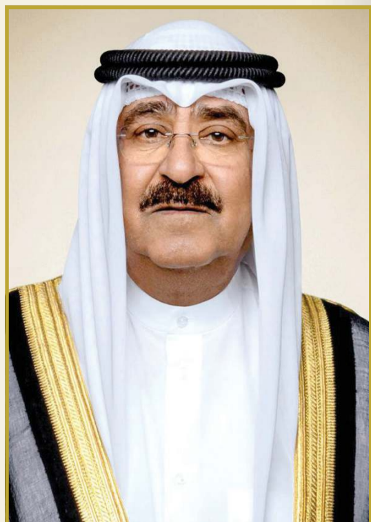
صاحب السمو الأمير الشيخ مشعل الأحمد حفظه الله ووراه