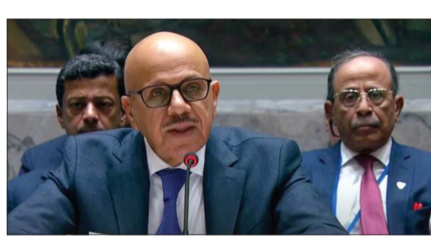
وزير خارجية البحرين عبداللطيف بن راشد الزياني مقرئاً جلسة مجلس الأمن

عواصم - وكالات: ترأس وزير خارجية البحرين