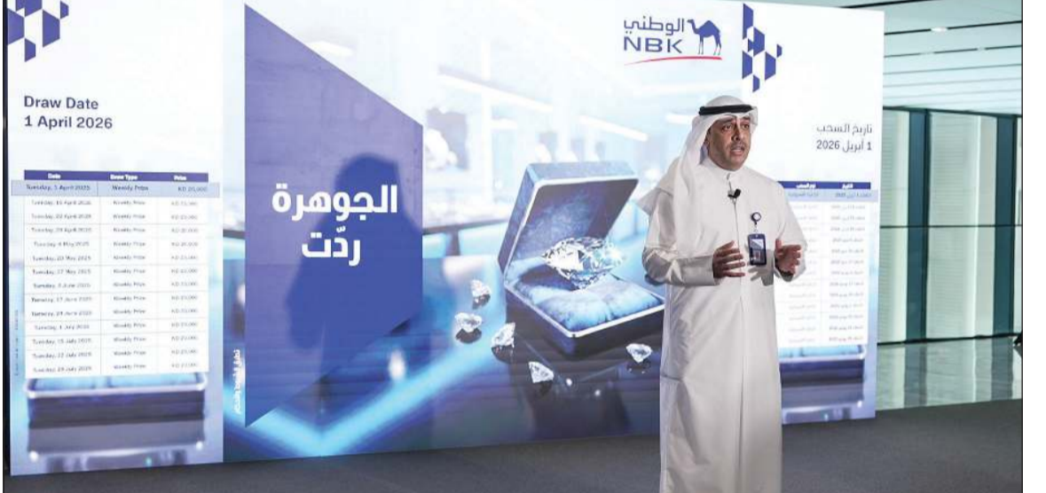
علي يوسف الملا نائب أول للرئيس - شبكة علاقات الفروع في مجموعة الخدمات المصرفية الشخصية