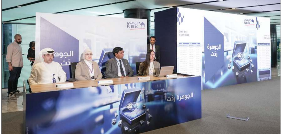
ممثلو شركتي جرانث ثورنتون ودبليتو يشرفون على عملية السحبوات