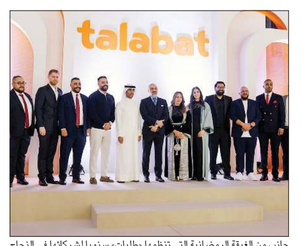
جانب من البعثة الرمضانية التي تنظمها «طلبات»، سنويا لشركائها في النجاح