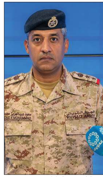
العقيد الركن سعود العطوان

كويتا: أعلنت وزارة الدفاع أمس أن القوات المسلحة رصدت ثلاثة صواريخ جوالة و15 طائرة مسييرة معادية داخل المجال الجوي خلال الـ24 ساعة الماضية وتم التعامل معها وفق الإجراءات المتبعة. وقال المتحدث الرسمي باسم «الدفاع» العقيد الركن سعود العطوان في كلمة له خلال الإيجاز الإعلامي بشأن التطورات والأحداث العملياتية إن هذا العدوان الإيراني الأثم أسفر عن استهداف خزان وقود تابع لمطار الكويت الدولي وتم التعامل معه من قبل الفرق المختصة. وأضاف العقيد الركن العطوان إن هناك شظايا سقطت على أحد المنازل في إحدى المناطق السكنية دون وقوع أي إصابات بشرية. وبين أن فرقة من مجموعة التفتيش والتخلص من المتفجرات التابعة لهيئة القوة البرية