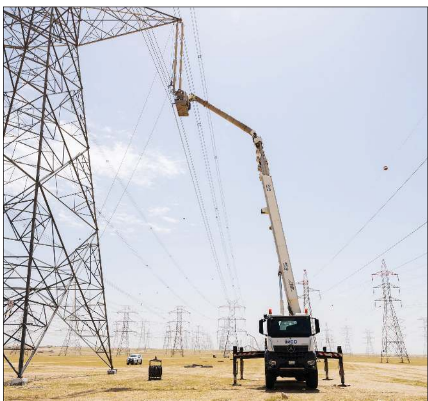
جانب من عملية إصلاح الخطوط الهوائية

وأشار إلى أن فرق الطوارئ باشرت أعمالها وفق خطط الطوارئ المعتمدة للتعامل مع تداعيات الحادث، مع الحرص على استمرار كفاءة التشغيل، بالتوازي مع التنسيق الكامل مع الجهات المختصة لتأمين الموقع المتضرر. وأضاف وكيل الوزارة أن الأحداث الأخيرة والاعتداءات