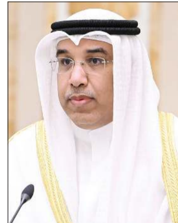
عبد العزيز سعود الجارالله يؤدي اليمين القانونية سفيراً فوق العادة ومفوضاً للكويت لدى هولندا