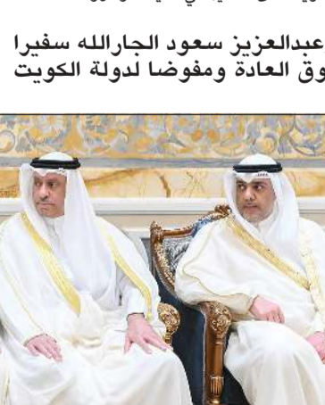
السفراء نايف المضيف وعبد العزيز العجمي ومحمد الرومي وسالم الجبران