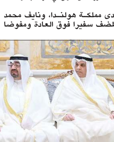
السفراء نايف المضيف وعبد العزيز العجمي ومحمد الرومي وسالم الجبران