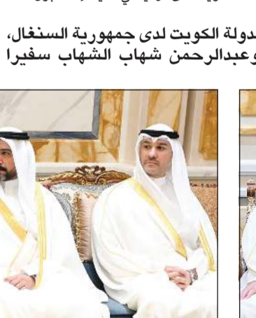
السفراء نايف المضيف وعبد العزيز العجمي وخالد الخليفة