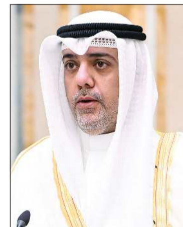
سالم حمد الجبران يؤدي اليمين قنصلاً عاماً للكويت لدى الولايات المتحدة الأمريكية في مدينة لوس أنجلوس