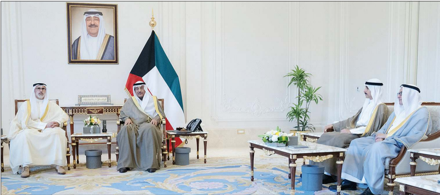
سمو ولي العهد الشيخ صباح الخالد خلال استقبال وزير الخارجية الشيخ جراح الجابر ومساعد وزير الخارجية لشؤون المراسم الوزير المفوض عبد المحسن الزيد ورؤساء البعثات الدبلوماسية الجدد بحضور رئيس ديوان سمو ولي العهد الشيخ ثامر الجابر والسفير منصور العتيبي