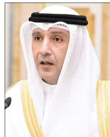
عبد العزيز سعود الجارالله سفيراً فوق العادة ومفوضاً للكويت