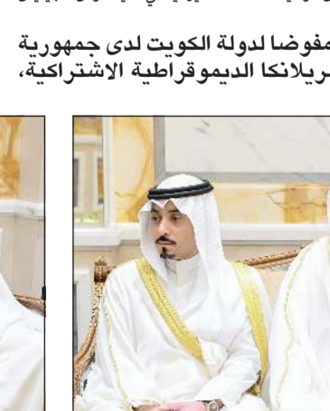
السفراء نايف المضيف وعبد العزيز العجمي ومحمد الرومي وسالم الجبران

كونا: استقبل صاحب السمو الأمير الشيخ مشعل الأحمد وزير الخارجية سمو رؤساء البعثات الدبلوماسية الكويتية الجدد كلا من صالح مبارك الصرعاوي سفيراً فوق العادة ومفوضاً لدولة الكويت لدى جمهورية سريلانكا الديموقراطية الاشتراكية، وعبد العزيز سعود الجارالله سفيراً فوق العادة ومفوضاً لدولة الكويت لدى مملكة هولندا، ونايف محمد المضيف سفيراً فوق العادة ومفوضاً لدولة الكويت لدى جمهورية السنغال، وعبد الرحمن شهاب الشهاب سفيراً فوق العادة ومفوضاً لدولة الكويت لدى الجمهورية العربية السورية، ومحمد علي الرومي سفيراً فوق العادة ومفوضاً لدولة الكويت لدى جمهورية اليونان، وسالم حمد الجبران قنصلاً عاماً لدولة الكويت لدى الولايات المتحدة الأمريكية في مدينة لوس أنجلوس، وعبد الله أحمد السالم قنصلاً عاماً لدولة الكويت لدى جمهورية الصين الشعبية في مدينة كوانزو، وعبد العزيز عماش العجمي قنصلاً عاماً لدولة الكويت لدى جمهورية العراق في مدينة البصرة، وخالد بدر الخليفة قنصلاً عاماً لدولة الكويت لدى الجمهورية التركية في مدينة إسطنبول، الذين أدوا اليمين القانونية أمام سموه، وذلك بمناسبة توليهم مهام مناصبهم الجديدة. كما استقبل سمو ولي العهد الشيخ صباح الخالد بقصر بيان وزير الخارجية الشيخ جراح الجابر، حيث قدم إلى سموه رؤساء البعثات الدبلوماسية الجدد كلا من صالح مبارك الصرعاوي سفيراً فوق العادة