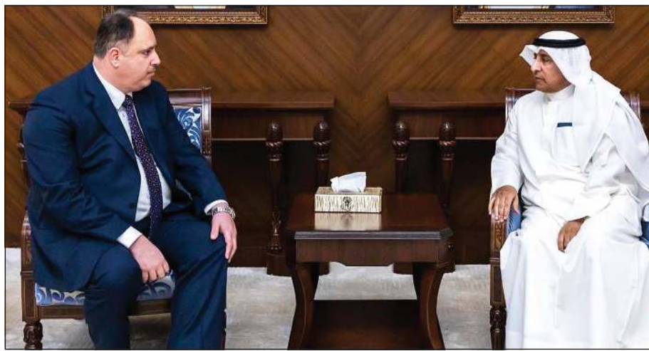
نائب وزير الخارجية بالوكالة السفير عزيز الديحاني مستقبلاً القائم بأعمال سفارة جمهورية العراق لدى دولة الكويت د.زيد عباس شنشول

استدعت وزارة الخارجية، الخارجية بالوكالة السفير عزيز الديحاني، القائم بأعمال سفارة جمهورية العراق لدى دولة الكويت د. زيد عباس شنشول، وذلك لتسليمه مذكرة احتجاج للمرة الثانية على إثر استمرار الاعتداءات التي تشنها فصائل مسلحة عراقية واستهدفت الأراضي الكويتية. وأكد نائب الوزير بالوكالة أن شن هجمات مسلحة على دولة الكويت تستخدم فيها أراضي جمهورية العراق هو عدوان على دولة الكويت واعتداء على سيادتها وانتهاك لقواعد القانون الدولي وميثاق الأمم المتحدة، مندداً على رفضها هذه الاعتداءات الخطيرة، ومطالباً الحكومة العراقية باتخاذ كل الإجراءات اللازمة ضد المعتدين لردعهم عن هذه الممارسات. كما جدد التأكيد على حق دولة الكويت الكامل والأصيل في الدفاع عن نفسها بموجب المادة 51 من ميثاق الأمم المتحدة واتخاذ كل الإجراءات اللازمة والمشروعة للتصدي لهذه الاعتداءات التي تهدد أمنها وسيادتها وسلامة أراضيها.