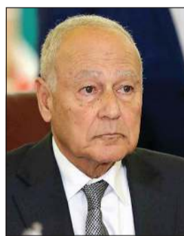
الأمين العام لجامعة الدول العربية أحمد أبو الغيط