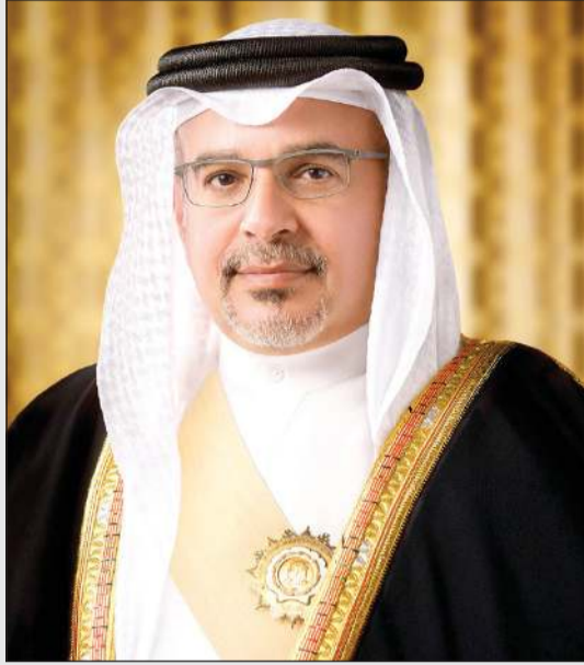
صاحب السمو الملكي الأمير سلطان بن حمد آل خليفة

سلطان بن حمد: تضامن كامل مع الكويت في كل ما تتخذه من إجراءات للحفاظ على سيادتها وأمنها واستقرارها وسلامة أراضيها