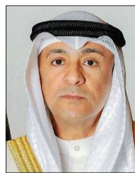
الأمين العام لمجلس التعاون لدول الخليج العربية جاسم البديوي