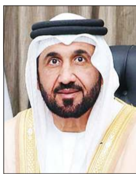
رئيس البرلمان العربي محمد اليماني

وجدد أبو الغيط في بيان تأكيده أن «أي اعتداء عسكري إيراني على أي دولة عربية مهما كان شكله أو حجمه مرفوض ومستنكر بشكل قاطع».