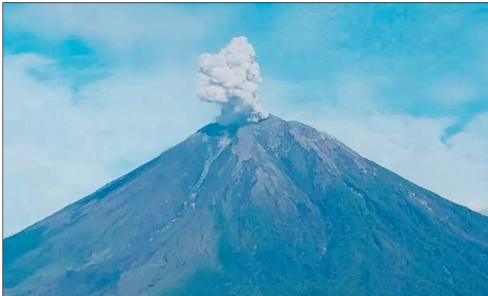
صورة أرشيفية لبركان سيميو