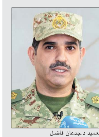
العميد دجعدان فاضل

الداخلية العميد ناصر بوضليب خلال الإيجاز الإعلامي بشأن الأحداث الراهنة واستعراض آخر التطورات الميدانية في ضوء العدوان الإيراني على الكويت، وذكر العميد بوضليب أن فرق التخلص من المتفجرات تعاملت مع تسعة بلاغات مرتبطة بسقوط شظايا ناتجة عن عمليات الاعتراض الدفاعي خلال الـ 24 ساعة الماضية، ليرتفع مجموع البلاغات منذ بداية العدوان إلى 588 بلاغا.