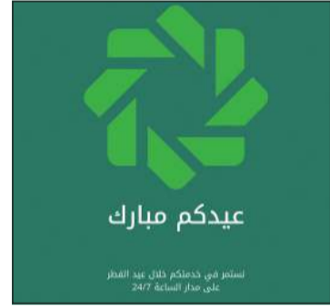
بيت التمويل الكويتي يواصل خدمة عملائه إلكترونياً

ويواصل فريق بيت التمويل الكويتي على قنوات التواصل الاجتماعي الرد على استفسارات العملاء وخدمتهم على مدار الساعة عبر مختلف حساباته على قنوات التواصل الاجتماعي.