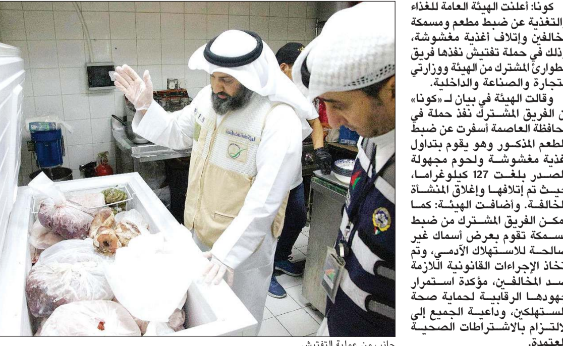
جانب من عملية التفتيش

كونا: أعلنت الهيئة العامة للغذاء والتغذية عن ضبط مطعم ومسمكة مخالفين وإتلاف أغذية مغشوشة، وذلك في حملة تفتيش نفذها فريق الطوارئ المشترك من الهيئة ووزارات التجارة والصناعة والداخلية. وقالت الهيئة في بيان لـ «كونا» إن الفريق المشترك نفذ حملة في محافظة العاصمة أسفرت عن ضبط المطعم المذكور وهو يقوم بتداول أغذية مغشوشة ولحوم مجهولة المصدر بلغت 127 كيلوغراماً، حيث تم إتلافها وإغلاق المنشأة المخالفة. وأضافت الهيئة: كما تمكن الفريق المشترك من ضبط مسمكة تقوم بعرض أسماك غير صالحة للاستهلاك الآدمي، وتم اتخاذ الإجراءات القانونية اللازمة ضد المخالفين، مؤكدة استمرار جهودها الرقابية لحماية صحة المستهلكين، وداعية الجميع إلى الالتزام بالاشتراطات الصحية المعمدة.