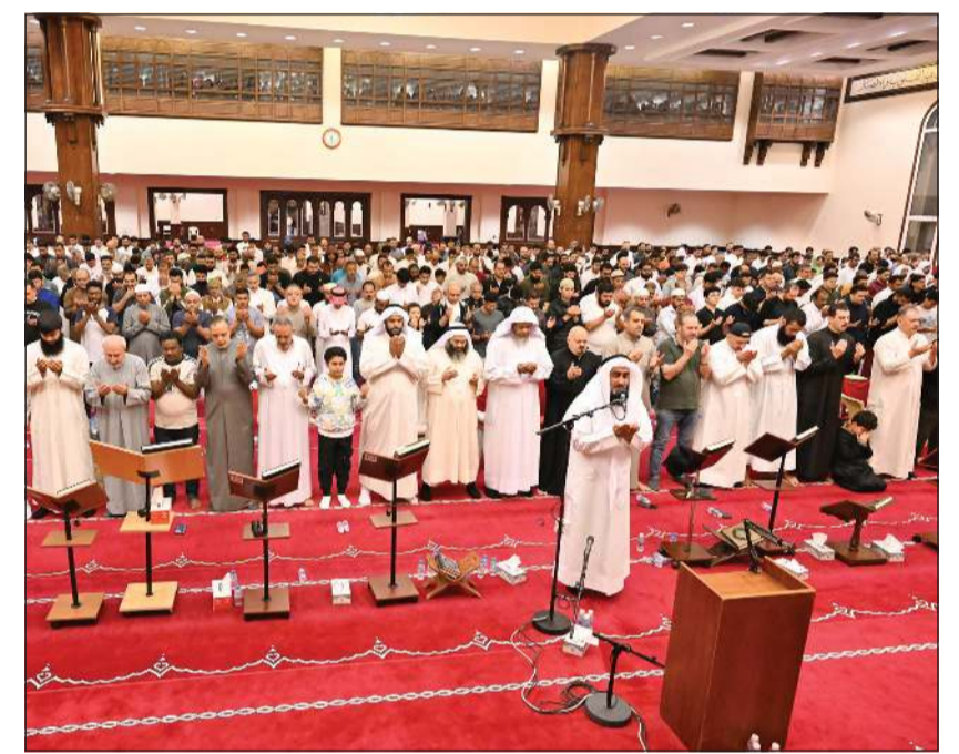
جموع المصلين خلال إحياء آخر ليالي الشهر الفضيل (قاسم باشا)

في مشهد إيماني مهيب، أحيا المواطنون والمقيمون ليلة الثلاثين من شهر رمضان بإداء صلاة القيام، مودعين أيام الشهر الفضيل المباركة بقلوب خاشعة ونفوس يملؤها الرجاء، والامل في القبول والغفران والعق من النيران. وشهدت المساجد أجواء روحانية عامرة، امتزجت فيها مشاعر الخشوع بصدق الوداع، في ختام شهر عظيم تزود فيه رواد المساجد بالطاعات والقرابات، سائلين المولى عز وجل القبول والعق من النار، وقد بدأ حرصهم على اغتنام اللحظات الأخيرة من الشهر الكريم، في مشهد يجسد معاني الإيمان، ويختتم موسماً حافلاً بالخير والبركة. وفي ختام الصلاة، ابتهل الأئمة إلى الله تعالى أن يحفظ الكويت وقيادتها وشعبها والمقيمين على أرضها، وأن يديم عليها الأمن والأمان، وأن يدفع عنها غدر الغادرين وكيد الكائدين، وأن يعيد شهر رمضان على الجميع بالخير والبركات.