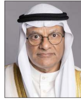
وزير التعليم العالي والبحث العلمي د. نادر الجلال

والخدمات المدنية ووزارة شؤون مجلس الوزراء شريدة المعوشي إنه تم لم يتقدموا بطلب لمعادلة مؤهلاتهم الدراسية وإنه يجري اتخاذ اللازم بشأنهم مع جهات عملهم. جاء ذلك في تصريح لـ «كونا» عقب ترؤسه اجتماعاً للجنة فحص الشهادات الدراسية للعاملين في القطاع الحكومي والخاص من المواطنين والمقيمين بحضور وزير التعليم العالي والبحث