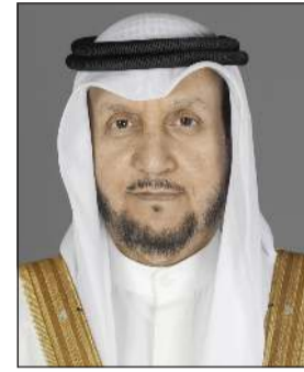
نائب رئيس مجلس الوزراء ووزير الدولة لشؤون مجلس الوزراء شريدة المعوشي

إرسال اللجنة للإشعارات عبر تطبيق «سهل» لتحديث بيانات المؤهل الدراسي للموظفين لضمان استمرار حقوقهم المالية والوظيفية. وأشار إلى الانتهاء من إرسال 14420 إشعاراً للموظفين شملت 23 جهة حكومية منذ الخامس من شهر يناير الماضي وحتى التاسع من شهر فبراير الماضي وذلك كحصول أولية فيما يتم حالياً استكمال العمل لبقية الجهات، كما أنه قد تم تعديل بيانات عدد 33829 موظفاً على النظم المتكاملة ممن