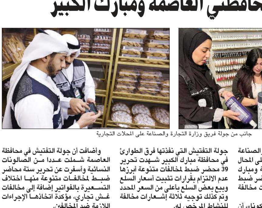
جانب من جولة فريق وزارة التجارة والصناعة على المحلات التجارية

كونا: نفذت وزارة التجارة والصناعة جولة تفتيش ميدانية موسعة على المحال التجارية في محافظتي العاصمة ومبارك الكبير أسفرت عن تحرير 45 محضر ضبط لعدم الالتزام بقرارات تثبيت أسعار السلع وبيع بعض السلع بأعلى من السعر المحدد وتم كذلك توجيه ثلاثة إشعارات مخالفة للنشاط المرخص له. وذكرت الوزارة، في بيان لـ «كونا»، أن جولة التفتيش التي نفذتها فرق الطوارئ في محافظة مبارك الكبير شهدت تحرير 39 محضر ضبط لمخالفات متنوعة أبرزها عدم الالتزام بقرارات تثبيت أسعار السلع وبيع بعض السلع بأعلى من السعر المحدد وتم كذلك توجيه ثلاثة إشعارات مخالفة للنشاط المرخص له. وأضافت أن جولة التفتيش في محافظة العاصمة شملت عدداً من الصالونات النسائية وأسفرت عن تحرير ستة محاضر ضبط لمخالفات متنوعة منها مخالفة التسعير بالفواتير إضافة إلى مخالفة غش تجاري، مؤكدة اتخاذها الإجراءات اللازمة ضد المخالفين.