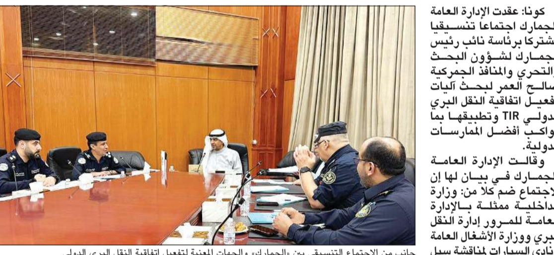
جانب من الاجتماع التنسيق بين «الجمارك» والجهات المعنية لتفعيل اتفاقية النقل البري الدولي

من المعوقات التشغيلية. وأكد الاجتماع أهمية تفعيل اتفاقية TIR لما لها من دور محوري في دعم حركة التجارة الدولية وتعزيز مكانة الكويت كمنزل لوجستي إقليمي، مبيّن أهمية استمرار التنسيق والمتابعة بين جميع الجهات ذات العلاقة لضمان التطبيق الفعال وتحقيق الأهداف المرجوة. واستعرض الاجتماع الجوانب الفنية والتشغيلية المرتبطة بتطبيق الاتفاقية بما في ذلك تطوير البنية التحتية الداعمة وتكامل