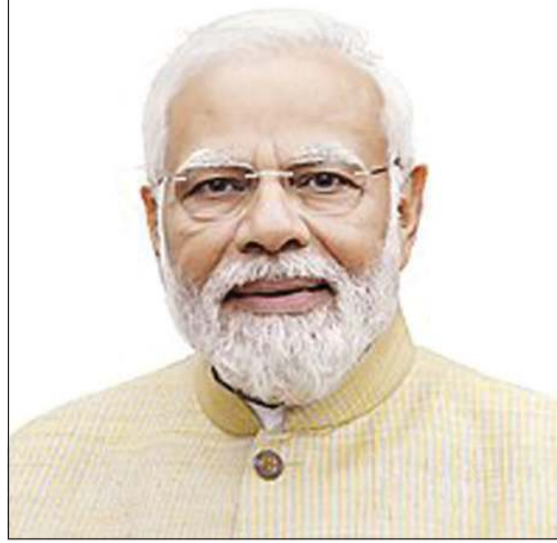
رئيس الوزراء الهندي ناريندرا مودي

الصديقة ناريندرا مودي نقل خلاله تحيات وتهاني الرئيسة دروبادي مورمو رئيسة جمهورية الهند الصديقة وتحياته إلى صاحب السمو الأمير الشيخ مشعل الأحمد وإلى