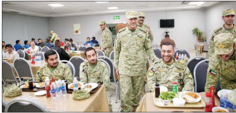
وكيل الحرس الوطني الفريق الركن حمد البرجس خلال زيارته التفقدية إلى أحد مواقع المسؤولية

والتصدي لأي تهديدات محتملة. ودعا الجميع إلى ضرورة التقيد بتعليمات الأمن والسلامة الصادرة عن الجهات المختصة.