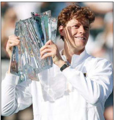
يانيك سينر خلال تتويجه باللقب