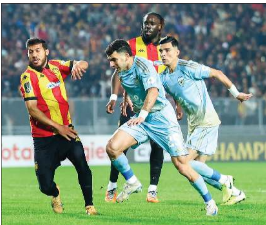
مواجهة الإياب بين الأهلي والترجي ستكون دون حضور جماهيري