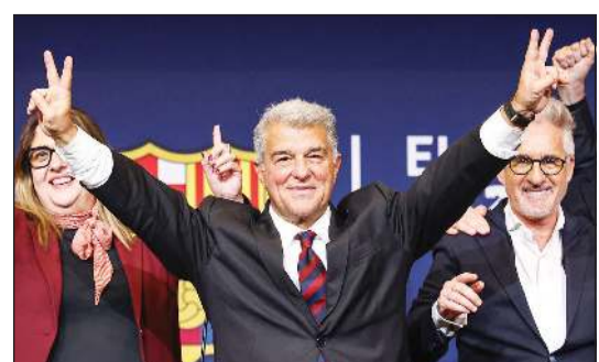
جوان لاهورتا مستمر في رئاسة نادي برشلونة

جديدة «هذه النتيجة تسعدنا للغاية وتمنحنا قوة هائلة، لدرجة أننا نعجز عن الكلام». وأضاف: «لن يوقفنا أحد. أنا على يقين بأننا سنشهد في السنوات المقبلة، كما قلت لكم، أوقاتا مثيرة. وشدد لاهورتا على أن برشلونة سيركز على إكمال إعادة بناء ملعب «كامب نو» الذي من المقرر الانتهاء منه عام 2027، أي بعد عام من الموعد المخطط له، بالإضافة إلى مواصلة الدفاع عن النادي ضد أي هجمات خارجية محتملة. وأضاف الرئيس المنتخب «صوت أعضاء النادي لصالح اقتراحنا، وهو أن ندافع جميعا عن برشلونة ضد كل شيء، ومن أي جهة».