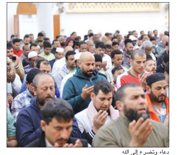
دعاء وتضرع إلى الله