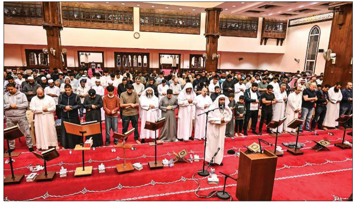
جانب من إحياء ليلة 22 رمضان في مسجد الراشد

وسط تنظيم مميز والتزام بتعليمات الجهات المختصة