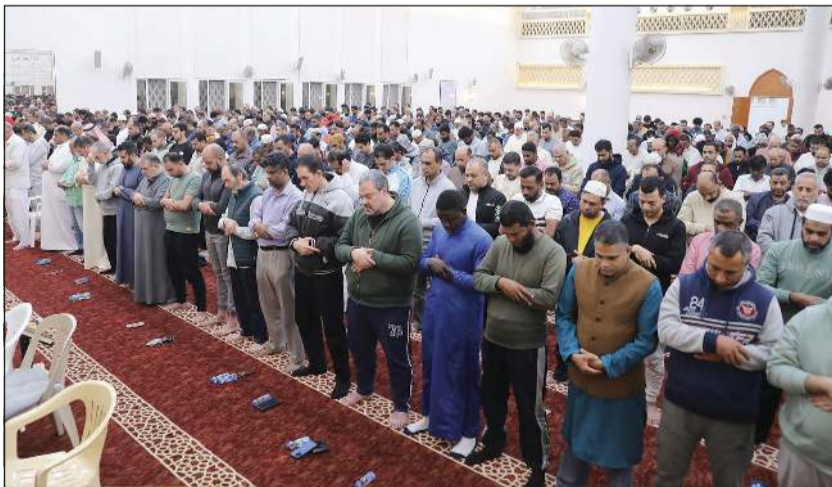
جموع المصلين خلال أداء صلاة القيام في ليلة 22 رمضان بمسجد سيبة الدعيح

وسط إجراءات وتنظيم مميز، والتزام تام بتعليمات الجهات المختصة، أحييت مساجد الكويت ليلة 22 من شهر رمضان المبارك لمدة 30 دقيقة من الساعة 12 حتى 12:30 بعد منتصف الليل، حيث أدى المصلون صلاة القيام في خشوع وسكينة، سائلين الله عز وجل قبول الطاعات والعق من النيران في هذه الأيام المباركة، راجين منه سبحانه وتعالى أن يحفظ الكويت من كل مكروه وسوء، ويديم عليها نعمة الأمن والأمان والاستقرار والرخاء.