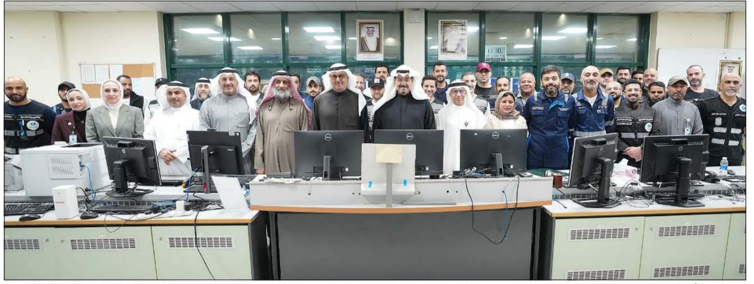
سمو الشيخ أحمد العبدالله رئيس الوزراء خلال زيارته إلى مركز التحكم الوطني للمياه برفقة وزير الكهرباء والماء والطاقة المتجددة د.عادل محمد الزامل والوكيل المساعد لشؤون محطات القوى وتقطير المياه م.هيثم العلي والوكيل المساعد لقطاع الخدمات الفنية م.فلاح السبيعي وقيادات وكوادر الوزارة