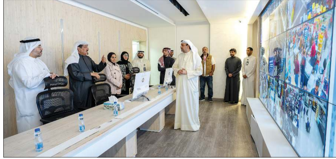
سمو الشيخ أحمد العبدالله رئيس الوزراء خلال زيارته غرفة التحكم المركزية التابعة لوزارة الشؤون برفقة وزيرة الشؤون الاجتماعية وشؤون الأسرة والطفولة د.أمثال الحويلة ووكيل الوزارة د.خالد العجمي وعدد من المسؤولين

كوونا: قام سمو الشيخ أحمد العبدالله رئيس مجلس الوزراء بزيارة تفقدية إلى مركز التحكم الوطني للمياه برفقة وزير الكهرباء والماء والطاقة المتجددة د.صباح المخيزيم ووكيل وزارة الكهرباء والماء والطاقة المتجددة د.عادل محمد الزامل. وأطلع سموه رئيس مجلس الوزراء على سير العمل في المركز ومتابعة وتشغيل منظومة المياه مستمعا إلى شرح من المسؤولين حول استقرار شبكة المياه وجاهزية الفرق لتعزيز الإجراءات الوقائية واستعدادها للتعامل مع أي طارئ. وأعرب سموه عن بالغ تقديره للكوادر الوطنية والطواقم العاملة في مركز التحكم الوطني للمياه، مثنيا ما يبذلونه من جهود مخلصه وتفان في أداء مهامهم في ظل هذه الظروف الاستثنائية لضمان استقرار الشبكة المائية بكفاءة عالية. ميناء الشويخ وقام سمو الشيخ أحمد العبدالله رئيس الوزراء بزيارة تفقدية إلى ميناء الشويخ برفقة وزير الأشغال العامة د.نورة الشعلان، ومدير عام مؤسسة الموانئ الشيخ خالد سالم العبدالعزير.