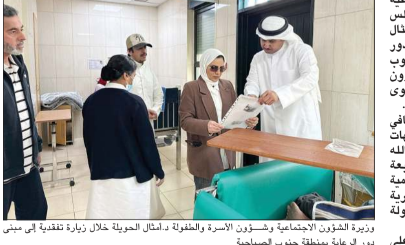
وزيرة الشؤون الاجتماعية وشؤون الأسرة والطفولة د.أمثال الحويلة خلال زيارة تفقدية إلى مبنى دور الرعاية بمنطقة جنوب الصباحية