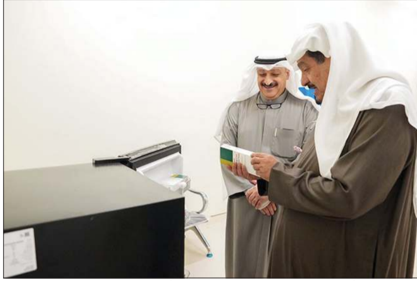
سمو الشيخ أحمد العبدالله يطلع على التجهيزات الطبية بملجأ الطوارئ في مستشفى الجهراء برفقة وزير الصحة د.أحمد العوضي