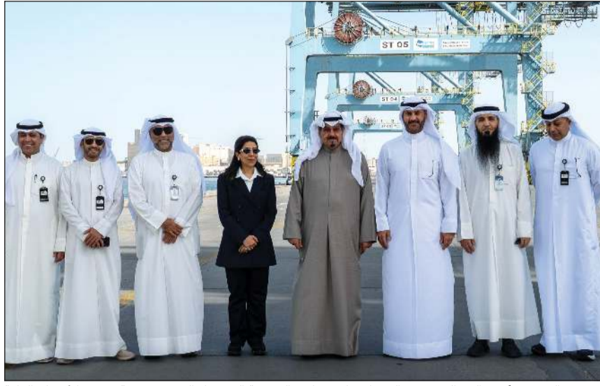
سمو الشيخ أحمد العبدالله رئيس الوزراء خلال زيارته التفقدية إلى ميناء الشويخ برفقة وزيرة الأشغال العامة د.نورة الشعلان ومدير عام مؤسسة الموانئ الشيخ خالد سالم العبدالعزير