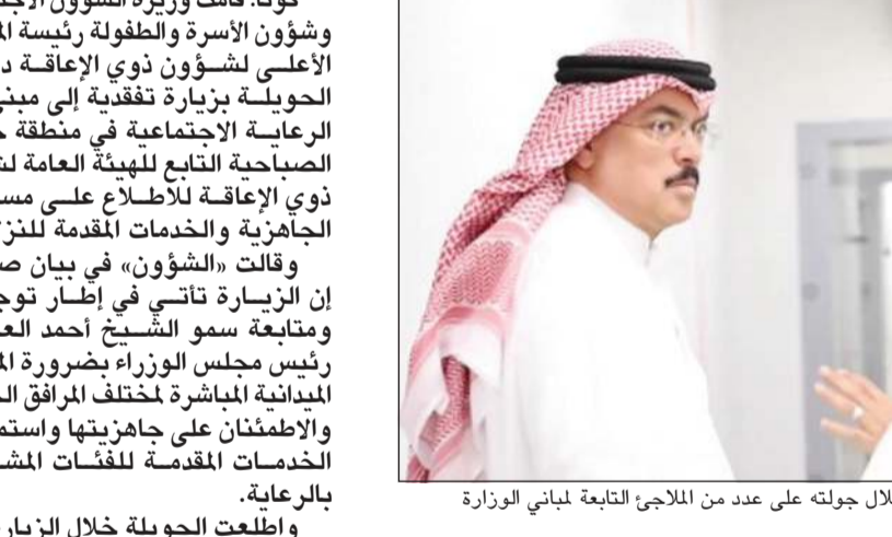
وزير التربية م.سيد جلال الطبائبي خلال جولته على عدد من الملاحي التابعة لمباني الوزارة

كوونا: قامت وزيرة الشؤون الاجتماعية وشؤون الأسرة والطفولة رئيسة المجلس الأعلى لشؤون ذوي الإعاقة د.أمثال الحويلة بزيارة تفقدية إلى مبنى دور الرعاية الاجتماعية في منطقة جنوب الصباحية التابع للهيئة العامة لشؤون ذوي الإعاقة للاطلاع على مستوى الجاهزية والخدمات المقدمة للنازلاء. وقالت «الشؤون» في بيان صحفي إن الزيارة تاتي في إطار توجيهات ومتابعة سمو الشيخ أحمد العبدالله رئيس مجلس الوزراء بحضوره المتابعة الميدانية المباشرة لاختلاف المرافق الخدمية والأطمئنان على جاهزيتها واستمرارية الخدمات المقدمة للفئات المشمولة بالرعاية. وأطلعت الحويلة خلال الزيارة على التجهيزات المتوفرة داخل المبنى بما في ذلك تجهيزات الملجأ وخطط الطوارئ المعتمدة لضمان سلامة النزلاء والعاملين، مؤكدة أهمية الاستعداد الكامل في مثل هذه الظروف وتوفير أعلى مستويات الرعاية والخدمات الصحية والإنسانية للأشخاص ذوي الإعاقة. وشددت على أن النزلاء والمرضى يحظون بالأولوية القصوى في الرعاية