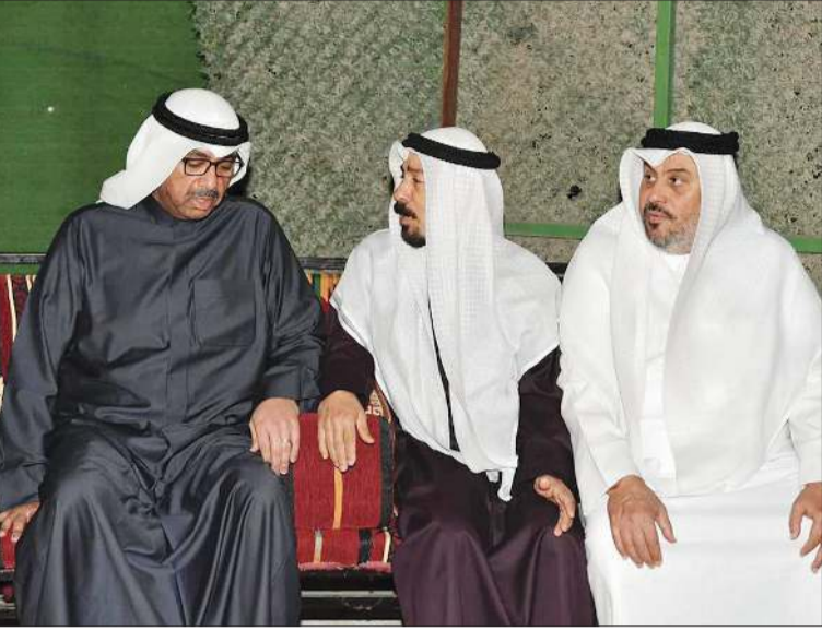
وزير الدفاع الشيخ عبدالله العلي خلال زيارة أهالي شهداء العمليات الحربية لتقديم واجب العزاء