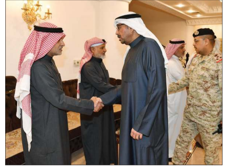
وزير الدفاع الشيخ عبدالله العلي خلال تقديم واجب العزاء

الوطن وصون أمنه واستقراره. ودعا المولى عز وجل أن يتغمد الشهداء بوسع رحمته ويسكنهم مسيح جناته، وأن يلهم ذويهم الصبر والسلوان.