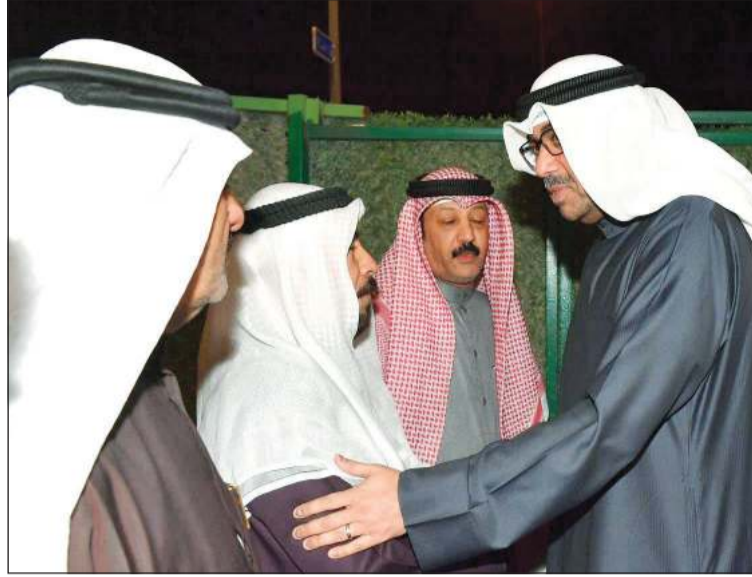
وزير الدفاع الشيخ عبدالله العلي معزيا أهالي الشهداء