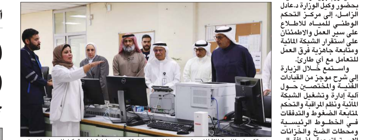
وزير الكهرباء والماء والطاقة المتجددة د. صبيح المخيزيم ووكيل وزارة الكهرباء د. عادل الزامل والوكيل المساعد لشؤون محطات القوى وتقطير المياه م. هيثم العلي خلال زيارة مركز التحكم الوطني للمياه

عن تقديره لجهود جميع العاملين في الوزارة، مؤكدا استمرار دعم القيادة العليا لكل ما من شأنه تطوير البنية التحتية لقطاعي الكهرباء والماء وتعزيز أمن واستدامة الموارد الحيوية في البلاد.