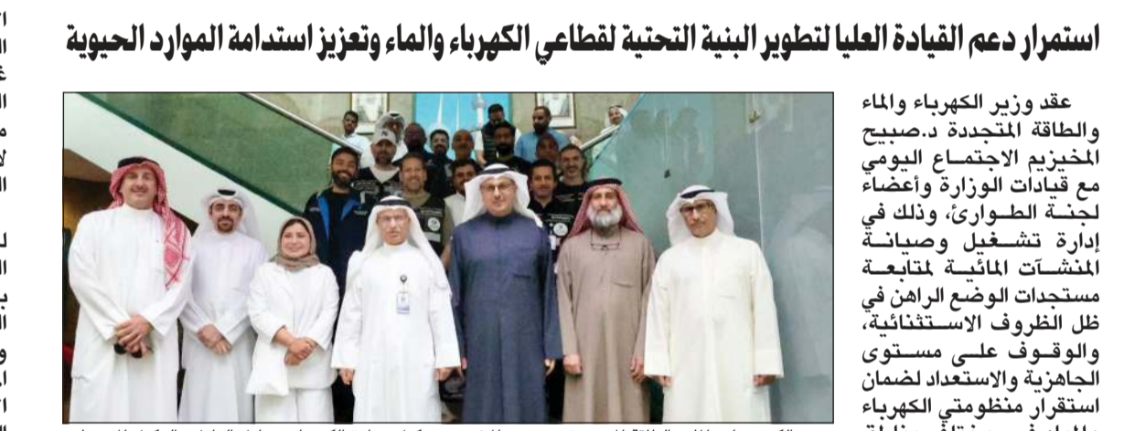
وزير الكهرباء والماء والطاقة المتجددة د. صبيح المخيزيم ووكيل وزارة الكهرباء د. عادل الزامل والوكيل المساعد لشؤون محطات القوى وتقطير المياه م. هيثم العلي والوكيل المساعد لقطاع الخدمات الفنية م. فلاح السبيعي مع قيادات الوزارة وأعضاء لجنة الطوارئ

وقد عقد وزير الكهرباء والماء والطاقة المتجددة د. صبيح المخيزيم الاجتماع اليومي مع قيادات الوزارة وأعضاء لجنة الطوارئ، وذلك في إدارة تشغيل وصيانة المنشآت المائية لمتابعة مستجدات الوضع الراهن في ظل الظروف الاستثنائية، والوقوف على مستوى الجاهزية والاستعداد لضمان استقرار منظومة الكهرباء والمياه في مختلف مناطق البلاد.