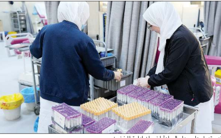
فرق بنوك الدم تعمل على مدار الساعة لضمان إدارة المخزون

جمع أكثر من 2000 كيس خلال فترة زمنية قصيرة مؤشر بوضوح الوعي المجتمعي بأهمية الدم