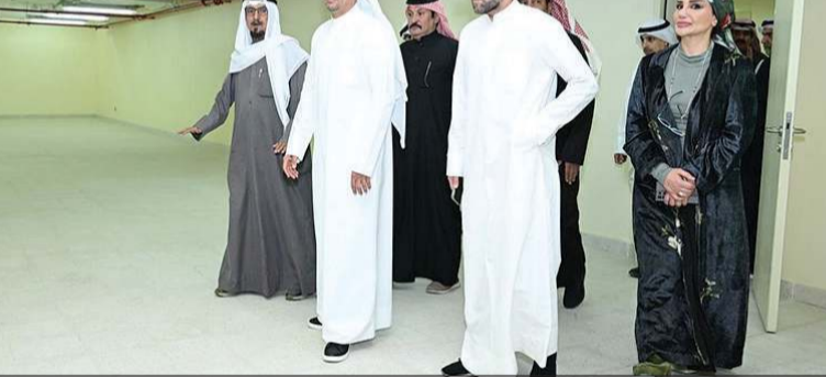
وزير الكهرباء والماء والطاقة المتجددة د. صبيح المخيزيم ووكيل وزارة الكهرباء د. عادل الزامل والوكيل المساعد لشؤون محطات القوى وتقطير المياه م. هيثم العلي خلال زيارة مركز التحكم الوطني للمياه مع قيادات الوزارة وأعضاء لجنة الطوارئ

وأكدت الهيئة أن الوزير الجاهمة شدد على أهمية تكامل الجهود بين مختلف مؤسسات الدولة، مشيدا