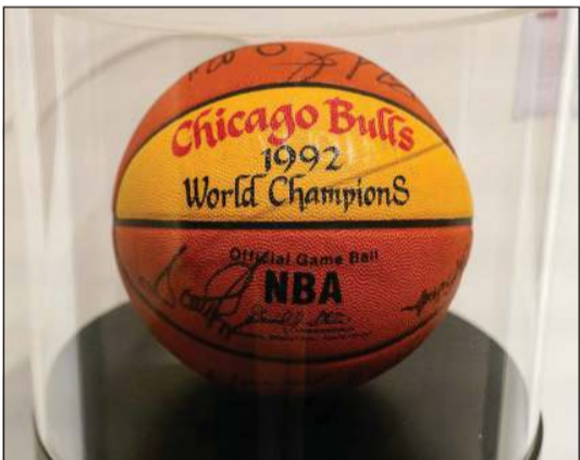
جانب من مقتنيات سكوتي بيبين المعروضة في نيويورك

بكثر من المعتاد... وتتجاوز الحصيلة الإجمالية المتوقعة لهذا المزاد بنحو 6 ملايين دولار. وتقدر قيمة القمصين الذي ارتداه بيبين خلال «مباراة الإنفلونزا» في نهائي الدوري عام 1997 ما بين 300 ألف و500 ألف دولار.