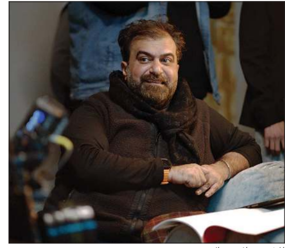
المخرج مناف عبدال

ياسر العيلة وسط الزحام الكبير الذي يشهده الموسم الرمضاني من أعمال متشابهة في الطرح والإيقاع، استطاع مسلسل «دراما كوين» للكاتب عيسى الكاظمي والمخرج مناف عبدال، أن يفرض حضوره بهدوء وثقة، معتمدا على فكرة ذكية ونص متماسك وكوميديا لطيفة بعيدة عن الابتذال من خلال تقديم وجبة درامية جميلة تسلط الضوء على العلاقات الأسرية والاجتماعية، مثل علاقات أبناء العم، والزواج، في إطار كوميدي جذاب بأسلوب إنساني خفيف، مدعوما بإداء تمثيلي صادق وإخراج متوازن، يؤكد أن التميز لا يحتاج إلى صخب بقدر ما يحتاج إلى رؤية واضحة واحترام لذات المشاهد. أكبر نقاط قوة المسلسل يكمن في فكرته الواضحة للكاتب عيسى الكاظمي، حيث قدمت نصا بلا مط درامي، واعتمدت من خلاله على مواقف يومية واقعية يستطيع المشاهد التعاطف معها، وناتي الكوميديا من الشخصيات نفسها وليس من «الإفشيات» المصطنعة، كل ذلك ضمن إطار يجمع بين الكوميديا الاجتماعية والدراما النفسية دون خطابية أو وعظ. كما يتميز السيناريو والحوار بالاعتدال في الأحداث، فلا مط ولا حشو، وهو أمر نادر في دراما رمضان. وعلى مستوى الإخراج للفريق مناف عبدال، فقد جاء ذكيا وبسيطا، بعيدا عن التكلف، واعتمد إيقاعا سريعا ولقطات قريبة تركز على تعبيرات الممثلين، بالإضافة للتوظيف الذكي لمواقع التصوير لتناسب طبيعة أحداث العمل، كما نجح في الحفاظ على توازن النغمة بين السخرية والدراما ومنع السخرية من الانزلاق إلى «الاستكشآت» المنفصلة.