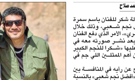
القاهرة - محمد صلاح