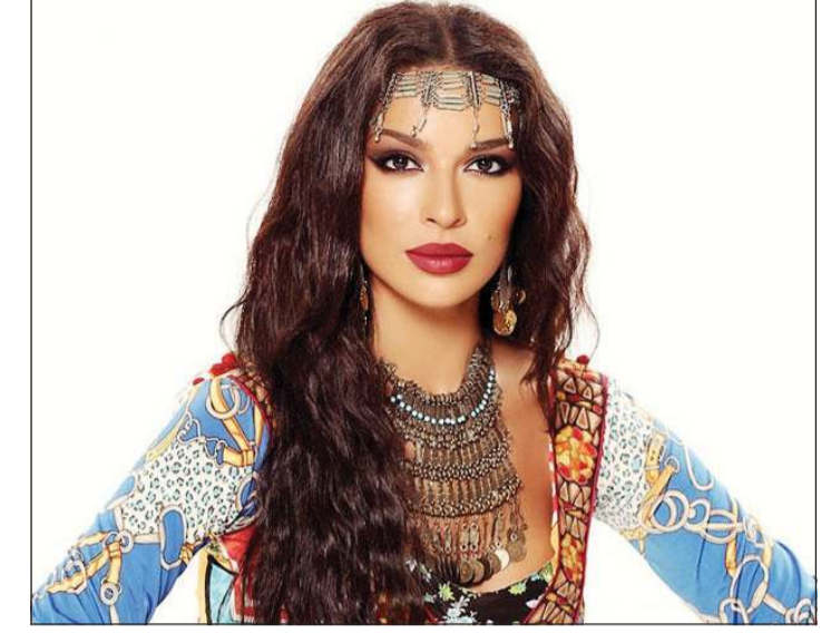
بيروت - بولين فاضل

ليس من المبالغة القول إن النجاح والنجومية كانا حليفين المثلثة نادين نسيب نجيم منذ بداياتها في التمثيل وحتى اليوم، وهي التي دخلت هذا الغمار من بوابة تاج الجمال وخالفت مقولة «كوني جميلة واصمتي». درست نادين إدارة الأعمال ونالت إجازة من كلية إدارة الأعمال في لبنان، وكانت بدأت العمل في عرض الأزياء في سن السادسة عشرة، ثم شاركت في مسابقة ملكة جمال لبنان عام 2004 وحصدت اللقب بعد فوزها على منافستها لامينا فرنجية. أما مجال التمثيل فدخلته عندما رشحتها الكاتبة شكري أنيس فاخوري في العام 2009 للمشاركة في مسلسل «خطوة حب» أمام الممثل عمار شلق ليكون تجربتها التمثيلية الأولى، حيث حصلت على جائزة «الموريكس دور» لعام 2010، وبدأ منذ ذلك الحين الحديث عن موهبة نادين وقوة حضورها، إضافة إلى جمالها. بعد ذلك، فتحت أمامها أبواب التمثيل على مصراعها فشاركت في عدد كبير من المسلسلات التلفزيونية بشكل شبه سنوي، وأبرزها «أجيال»، «عشق