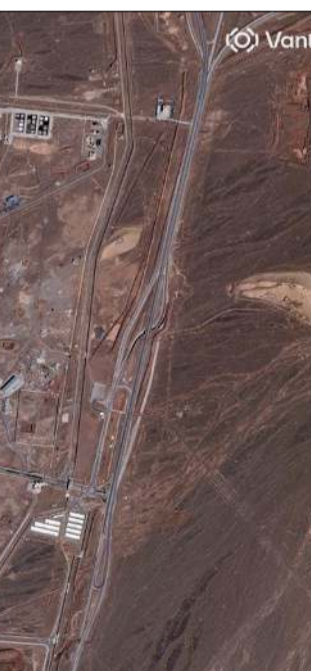
صورة أقمار اصطناعية تظهر دماراً لحق بمجمع نطنز النووي الإيراني

عواصم - وكالات: أكدت الولايات المتحدة أنها ستواصل اتخاذ إجراءات حاسمة ضد التهديد الإيراني، في وقت أعلن الجيش الإسرائيلي شن هجمات متزامنة على لبنان وإيران التي جددت قصف إسرائيل بالصواريخ والمسيرات، فضلاً عن استمرار اعتداءاتها على دول الخليج. وقالت القيادة المركزية الأميركية (سنتكوم) إنها دمرت «مراكز قيادة وسيطرة تابعة للحرس الثوري» وقدرات دفاع جوية إيرانية خلال عملياتها العسكرية ضد إيران. وذكرت «سنتكوم»، في بيان على صفحتها الرسمية بموقع التواصل الاجتماعي «إكس»، أن «بنك الأهداف العسكرية شمل مطارات عسكرية ومواقع إطلاق الصواريخ والطائرات المسيرة». وأكدت أن «الجيش الأميركي سيواصل اتخاذ إجراءات حاسمة ضد التهديدات الوشيكة التي يشكلها النظام الإيراني». وفي إيران، دوت أصوات الانفجارات العنيفة في طهران وأصفهان وعدد من المدن الأخرى، وأكدت وسائل إعلام إيرانية استهداف مواقع في منطقتي بريدس ودموند شرق طهران بعشرة صواريخ إسرائيلية. وأعلن الحرس الثوري أنه أسقط عدة طائرات مسيرة في عدد من المدن. وأفادت وسائل إعلام إيرانية بوقوع هجمات