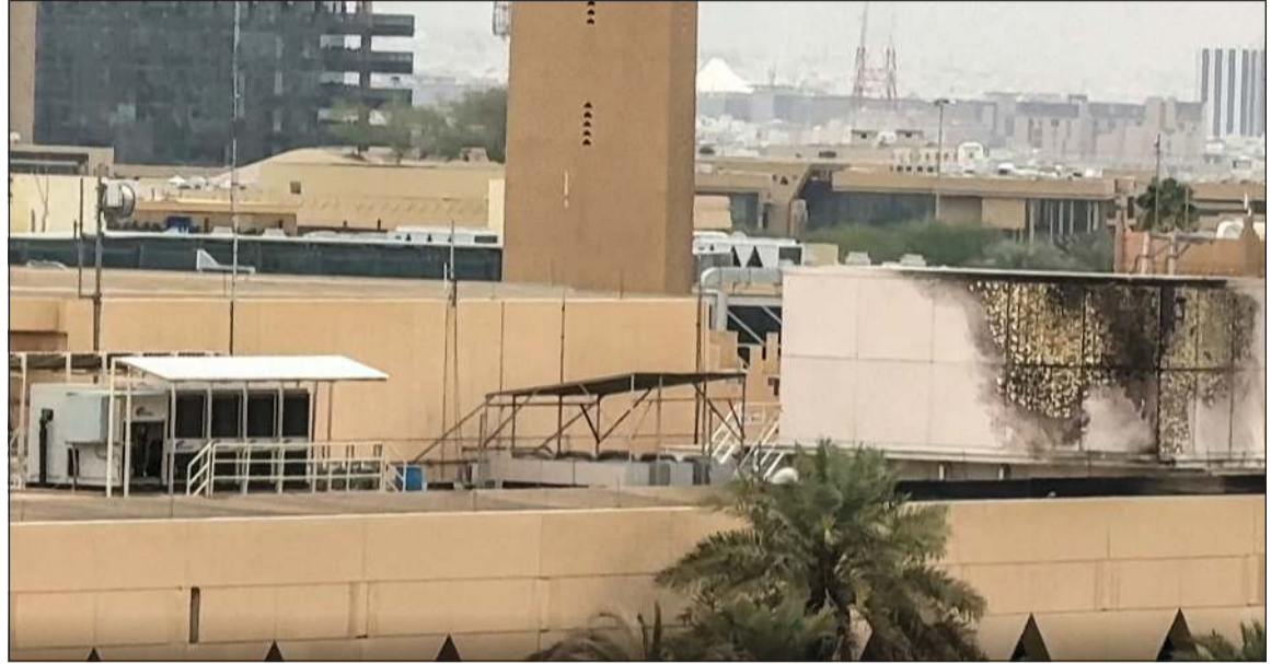
صورة عن تسجيل مصور للسفارة الأميركية في الرياض بعد الهجوم الإيراني

الأمناري: قطر أثبتت أنه لا يمكن تهديدها ومخزوننا من الصواريخ لم ينضب.. ومسقط: سنتخذ كل الإجراءات للحفاظ على أمننا