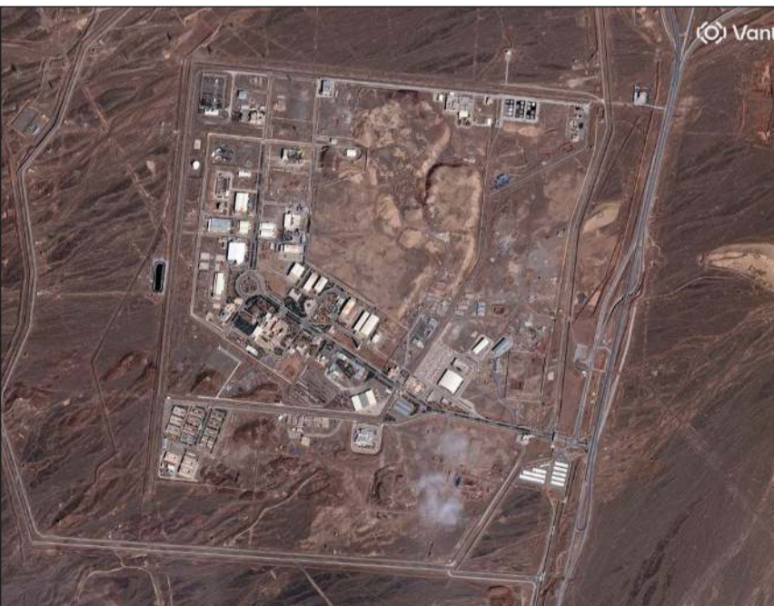
صورة أقمار اصطناعية تظهر دماراً لحق بمجمع نطنز النووي الإيراني