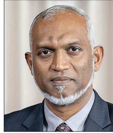
الرئيس د.محمد معزو رئيس المالديف