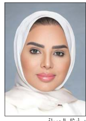
د. أمثال الحويلة

كونا: أعلنت وزيرة الشؤون الاجتماعية وشؤون الأسرة والطفولة د. أمثال الحويلة تفعيل خدمة إرسال تنبيهات فورية عبر التطبيق الحكومي الموحد للخدمات الإلكترونية (سهل) لذوي الإعاقة من فئة الإعاقات السمعية، وذلك عند إطلاق صافرات الإنذار في البلاد في حال وقوع أي خطر. وقالت الحويلة في تصريح صحفي إن تفعيل الخدمة جاء في إطار حرص الدولة على ضمان سلامة جميع فئات المجتمع وبالتنسيق مع اللجنة التنفيذية لتطبيق (سهل) وبالتعاون مع الإدارة العامة للدفاع المدني بما يضمن وصول الرسائل التحذيرية العاجلة إلى جميع المواطنين دون استثناء في الوقت المناسب. وأضافت أن هذه