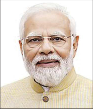
رئيس الوزراء الهندي ناريندرا مودي