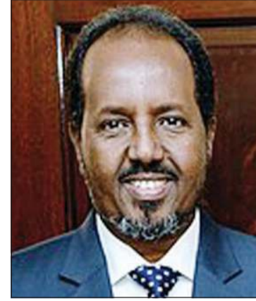
الرئيس حسن شيخ محمود رئيس الصومال