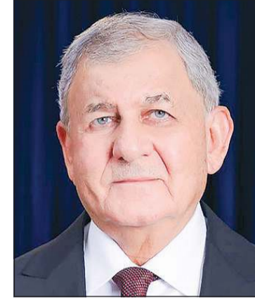
الرئيس العراقي عبد اللطيف رشيد