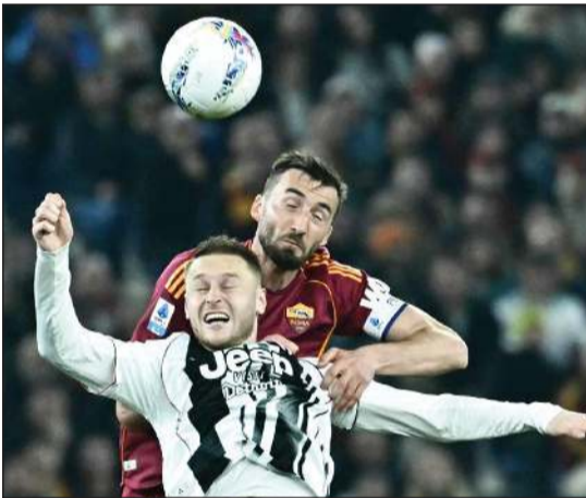
مواجهة يوفنتوس وروما انتهت بالتعادل الإيجابي

تأهله إلى ثمن نهائي مسابقة دوري أبطال أوروبا بعدما عجز تأخره بهدفين أمام بوروسيا دورتموند الألماني ذهاباً إلى فوز 1-4 إياباً في الملحق، بخسارته أمام مضيفة ساسولو 2-1. إلى ذلك، يلعب إينتر اليوم مع كومو في ذهاب نصف نهائي كأس إيطاليا.