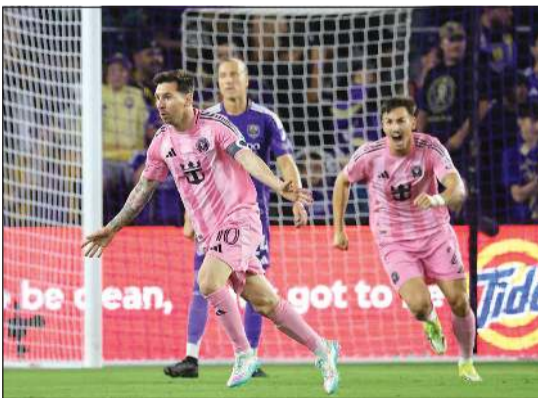
ليونيل ميسي يحتفل بتسجيله الهدف الثاني لإنتر ميامي

بتسديدة قوية يقمعه اليسرى تجاوزت كريبو، ثم لعب النجم الأرجنتيني دوراً محورياً في هدف التقدم 2-3 في الدقيقة 85، بعدما مرر كرة متقنة أناها القذوولي تيلاسكو سيغوفيا في الرمي. ووضع ميسي ختمه على الانتفاضة في الدقيقة 90، حين نفذ ركلة حرة منخفضة باغتت كريبو واستقرت في الشباك.