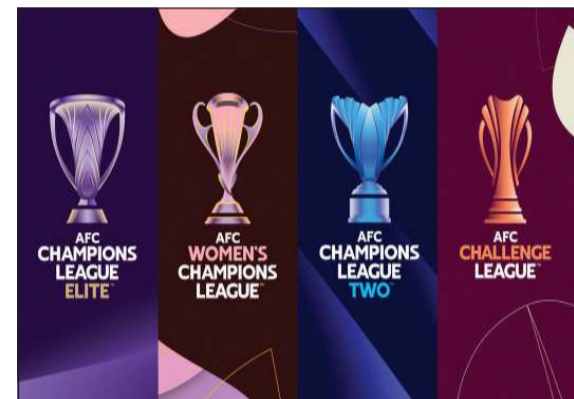
بطولات الاتحاد الآسيوي