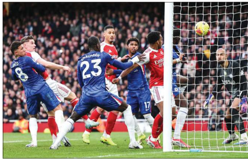
الكرات الثابتة سلاح أرسنال لتسجيل الأهداف

قدم الفريق أداء ممتازاً لفترات طويلة، وكان ينبغي أن يكون الفارق أكبر في الشوط الأول، لحظتها تقينا الهدف كانت مؤلمة، لكن هذه جودة تشلسي».