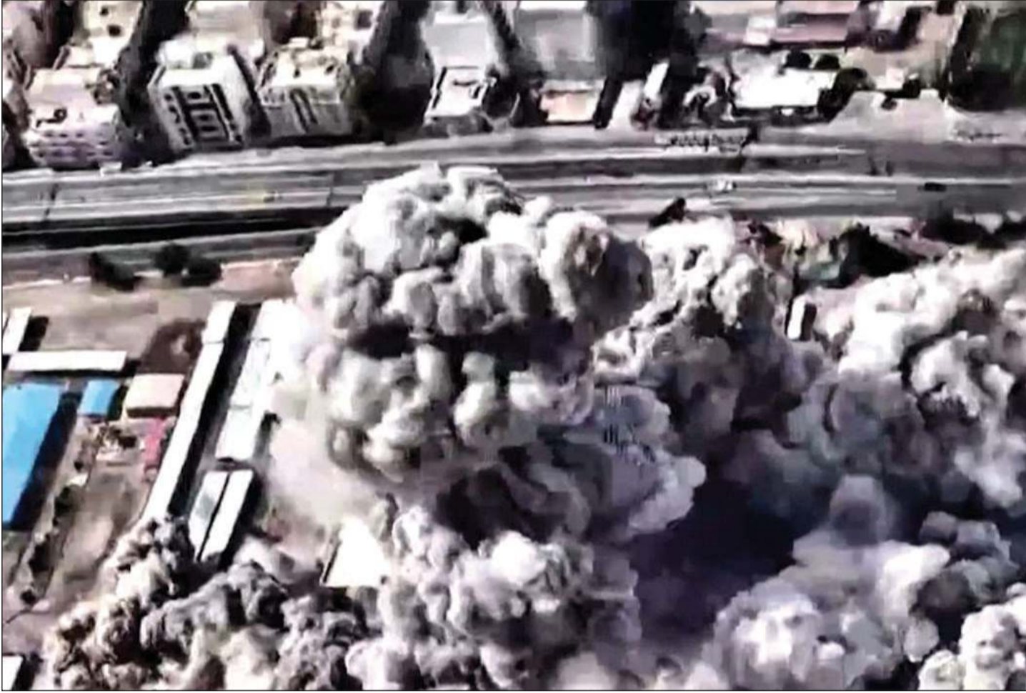
صورة عن تسجيل فيديو نشره الجيش الإسرائيلي لما قال أنه «قصف مقر قيادة النظام الإيراني»