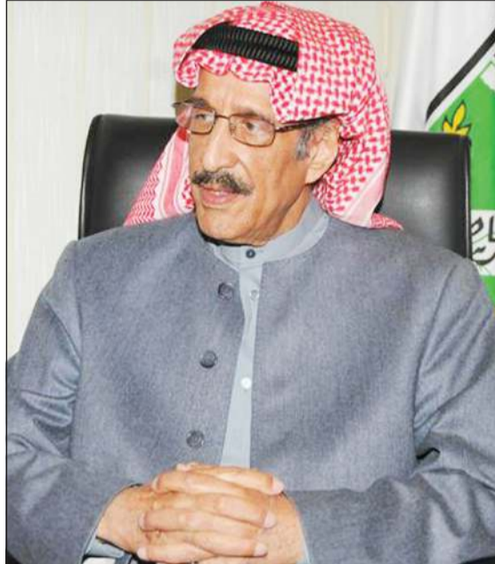
الشيخ سلمان الحمود - رحمه الله - شغل منصب رئيس النادي العربي

تمت تزكيته رئيسا لمجلس إدارة الاتحاد الكويتي لكرة القدم خلال 1976-1978 ورئيسا للجنة الأولمبية الكويتية عام 1988