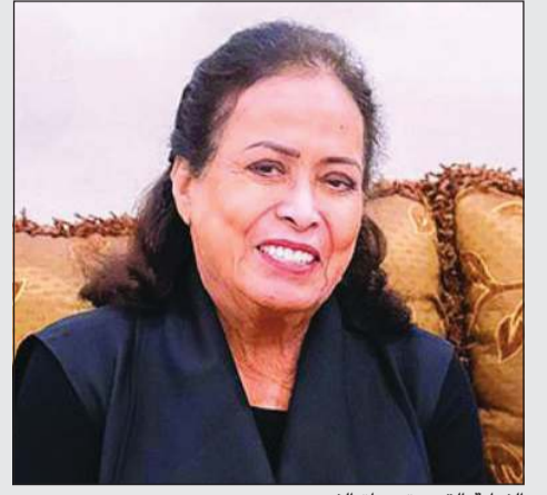
الفنانة القديرة حياة الفهد