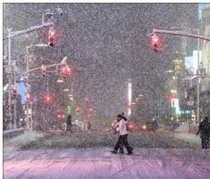
الثلوج تتساقط على ساحة التايمز في مانهاتن بسبب العاصفة الثلجية التي تضرب نيويورك