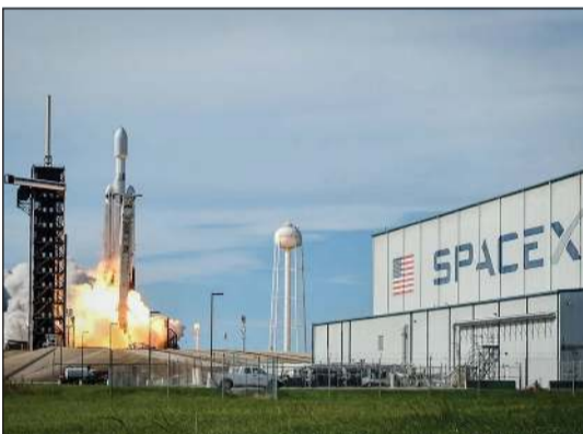
جانب من عملية الإطلاق الناجح لأقمار «ستار لينك» إلى الفضاء

واشنطن - «قنا»: أطلقت مؤسسة استكشاف الفضاء الأميركية «سبيس إكس» 53 قمرا اصطناعيا ضمن مجموعة «ستار لينك» في رحلتين إلى الفضاء. وذكرت المؤسسة أن صاروخي «فالكون 9» انطلقا من محطتي الإطلاق الفضائيتين في ولاية كاليفورنيا وفلوريدا، حاملين الأقمار الصناعية إلى المدار الأرضي المنخفض، والتي تم نشرها بنجاح بعد الوصول إلى المدار مباشرة. وشهدت الرحلتان اللتان تعدادان الإطلاقين الحادي والعشرين والثاني والعشرين لصاروخ «فالكون 9» خلال العام الحالي، رقما قياسيا جديدا في عدد مرات إعادة استخدام صواريخها، بحسب ما أوردت وكالة الأنباء القطرية الرسمية «قنا».