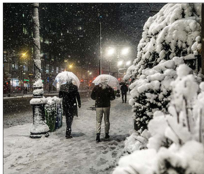
أميركيون يسيرون على الأقدام في ظل حظر لوسائل النقل بسبب العاصفة الثلجية في نيويورك

نيويورك - أ.ف.ب: فرضت نيويورك حظرا على حركة النقل في المدينة إلا للضرورات القصوى وأغلقت المدارس، مع وصول عاصفة ثلجية كبيرة تضرب شمال شرق الولايات المتحدة. وأصدر خبراء الأرصاد الجوية تحذيرا من عواصف ثلجية في نيويورك وفي ست ولايات على الأقل، وحذروا من تساقط الثلوج بكثافة وهبوب رياح عاتية يتوقع أن تضرب كل المدن الكبرى الواقعة على طول الطريق السريع 95 في شمال شرق البلاد، بما فيها بوسطن وفيلادلفيا، وحتى واشنطن إلى الجنوب. وبدأت العاصفة تضرب نيويورك مع الساعات الأولى من فجر الإثنين، ما أثر على الرؤية إلى حد أن ناطحات سحاب وول ستريت كانت بالكاد منظورة من حي بروكلين المجاور. وسجل تساقط ثلوج و«ضباب متجمد» مع درجات حرارة دنيا بلغت درجة مئوية واحدة تحت الصفر، بحسب ما ذكرت الهيئة الوطنية للأرصاد الجوية على موقعها الإلكتروني. وفي نزوة العاصفة، قد تراوح سماكة الثلوج المتساقطة بين خمسة وثمانية سنتيمترات في الساعة، وفقا للهيئة.