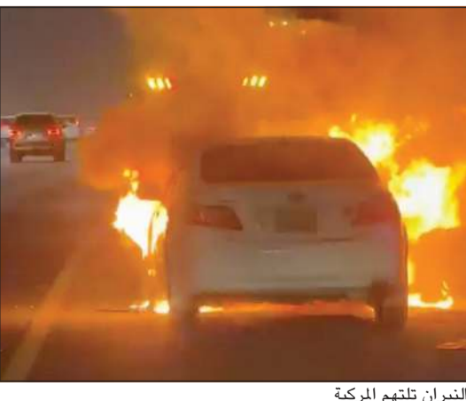
النيران تلتهم المركبة

التهمت النيران مركبة صالون على الدائري السادس، وقد تعامل مع الحريق رجال مركز إطفاء الجهوراء. ورجح مصدر أمني أن يكون الحريق بسبب تماس كهربائي أو لنقص المياه في الرادياتير، داعيا المواطنين والمقيمين إلى إجراء صيانة دورية للمركبات لتجنب مثل هذه الحوادث.