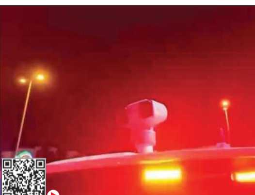
الحملة نفذت باستخدام دوريات ذكية مزودة بأحدث التقنيات (شبكة القبو)