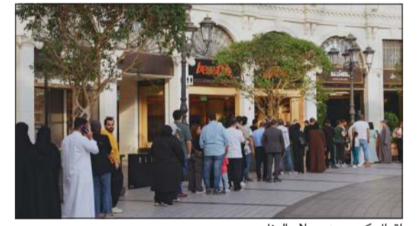
إقبال كبير من عملاء البنك

الصغيرة والمتوسطة، من خلال توزيع منتجاتها مجاناً على الجمهور، مما يساعدهم على توزيع منتجاتهم بشكل أكبر على الجمهور، ويحقق لهم المزيد من الانتشار والوصول إلى شرائح جديدة من العملاء، ويزيد قدرتهم على النمو والتوسع، الأمر الذي ينعكس إيجاباً على الاقتصاد الوطني بشكل عام. ويؤكد بنك الخليج التزامه بمواصلة جهوده على تعزيز معايير الاستدامة في المجتمع، على المستويات المجتمعية والاقتصادية والبيئية، عبر العديد من المبادرات التي يتم إنطلاقها بمناسبة ولادة بنك الخليج، بما يتوافق مع أهداف الأمم المتحدة للتنمية المستدامة ورؤية الكويت 2035.