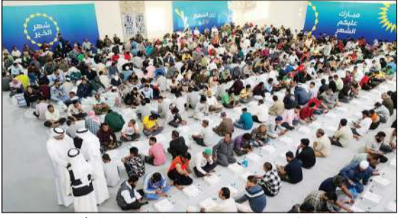
المبادرة تجسد غاية «زين» في تحقيق «اتصال دائم.. حياة أجمل»